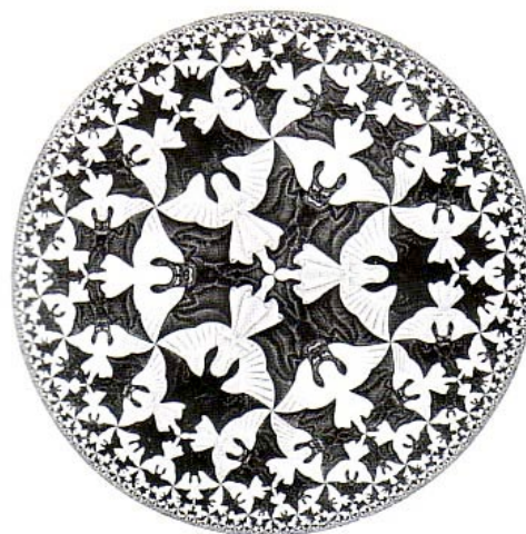
M. C. Escher, Límite circular IV , 1960.

He incluido los tres trabajos porque es significativo el hecho de que no haya espacio de entorno distinto de los cuerpos del doble. En la partición espacial toda la superficie está cubierta por los dos bandos, ángeles y diablos.