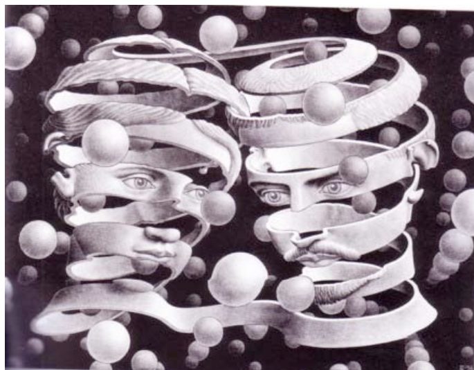
M. C. Escher. Banda de Unión , 1956

Entre ambas cabezas puede identificarse un total de tres uniones constituidas por la misma banda. Una en el extremo superior —a la altura de la coronilla; otra en el extremo inferior —a mitad del cuello; por último una a la altura de la frente, que simboliza la transmisión psíquica entre los dos hombres.