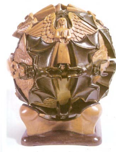
M. C. Escher, Esfera con Ángeles y diablos , 1942.

A diferencia de las dos obras analizadas con anterioridad, en que hay un espacio de entorno, que si bien va convirtiéndose en el doble en el caso de Cielo y agua , no deja de ser un espacio meramente ambiental. En Angeles y diablos no lo encontramos por ningún sitio. ¿Qué podría significar? Si en Cielo y agua la puerta surge en la separación de las superficies blanca y negra, aquí no existe una sola gran puerta, una sola frontera, sino una cantidad infinita de ellas (la serie Límite circular es una reflexión sobre el infinito).