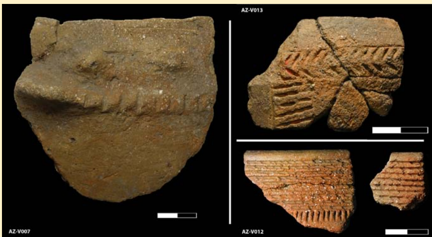
Figura 3. Cerámicas decoradas del yacimiento de Atxoste.

La incorporación durante el Neolítico de fauna doméstica (que está en proceso de estudio, así como todo lo referente a posible agricultura) no romperá, pensamos, esa dinámica. A falta de analíticas sobre la periodicidad de las visitas, de los posibles tratamientos de conservación alimenticia, etc., anticipamos un régimen vital parejo al de Mendandia, con las connotaciones que haya lugar, pues no son, exactamente, lugares gemelos.