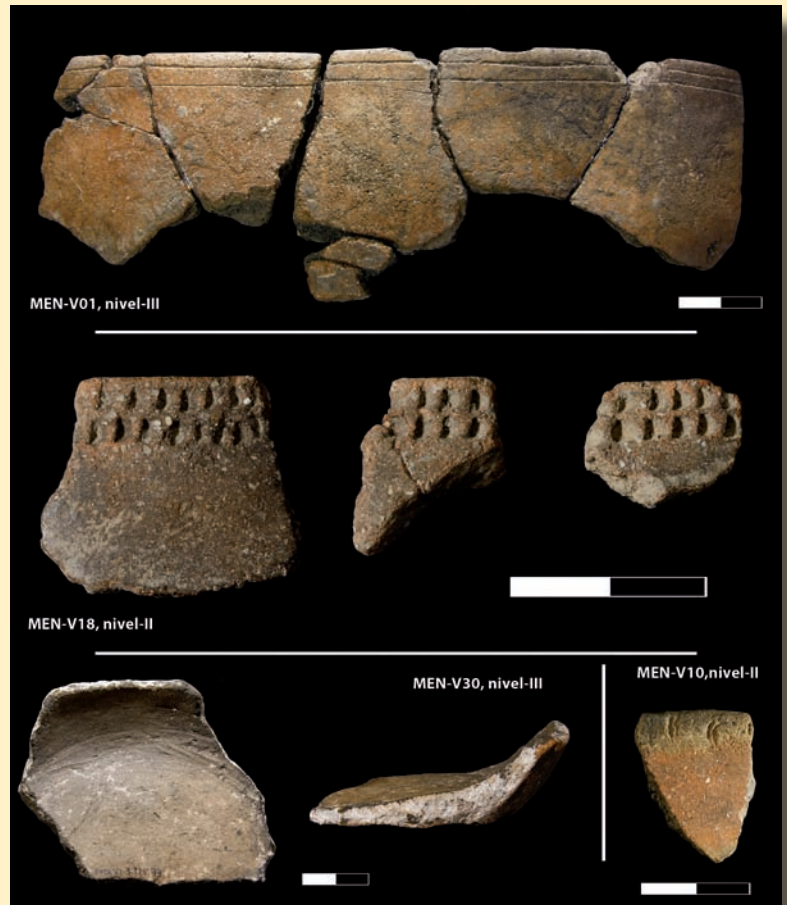
Figura 2. Cerámicas decoradas de Mendandia, con indicación del n° de Vaso y nivel de procedencia.

Las actividades cinegéticas desarrolladas en Mendandia debieron ser muy especializadas: caza, y desmembramiento de las piezas que, tras su ahumado, se trasladarían a un poblado permanente. La pirámide de edades de los animales abatidos indica un aprovechamiento mayor del sitio desde finales de la primavera y a lo largo del verano. Se entiende así la no recolección de productos vegetales. Este tipo de actividad continuó a lo largo del Neolítico, y es causa de que no se localicen en el lugar animales domésticos: para las fases finales de la ocupación ya se conocen en su entorno geográfico yacimientos con economía de producción. Queremos destacar que el estudio de las materias primas silíceas señala un patrón común en su gestión a lo largo de todos los periodos implicados, con ligeras variantes según los casos: explotación mayoritaria de afloramientos locales —a \pm 15 km— y minoritaria de los foráneos que, en cualquier caso, indican la conexión de aquellos grupos humanos con comarcas (¿y grupos?) muy alejados.