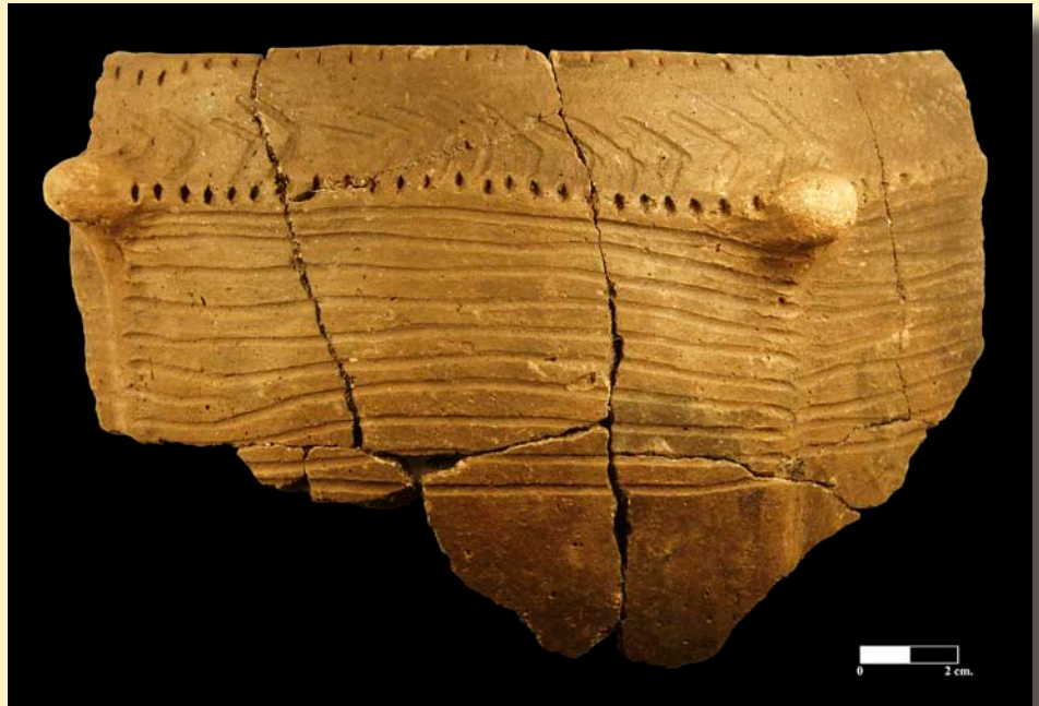
Figura 3. Vaso nº 47. Decoración incisa-impresa