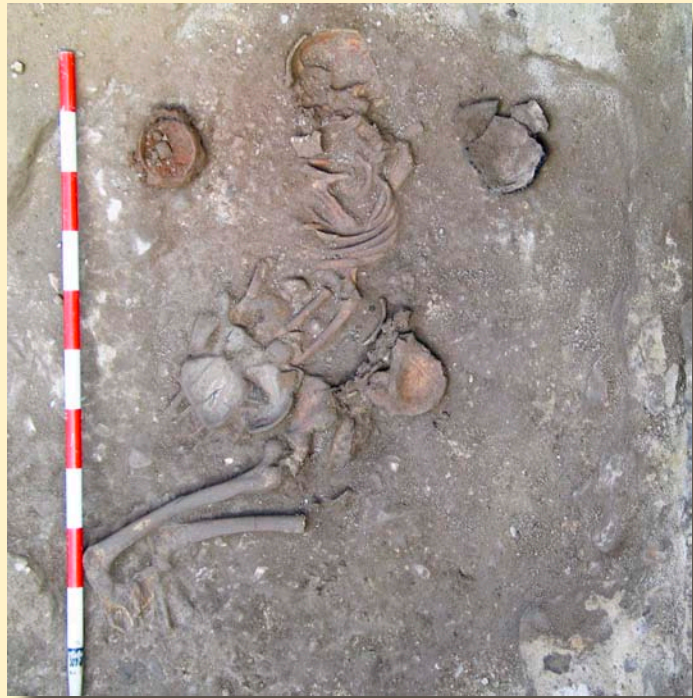
Figura 2. Inhumación individual de Molino de Arriba.

En este sentido no se han localizado en el yacimiento de Molino de Arriba otras estructuras que pudieran pertenecer a un asentamiento al aire libre de esta época, sin embargo esta circunstancia no resta importancia a este magnífico hallazgo por parte de Aratikos-Arqueólogos, S.L.