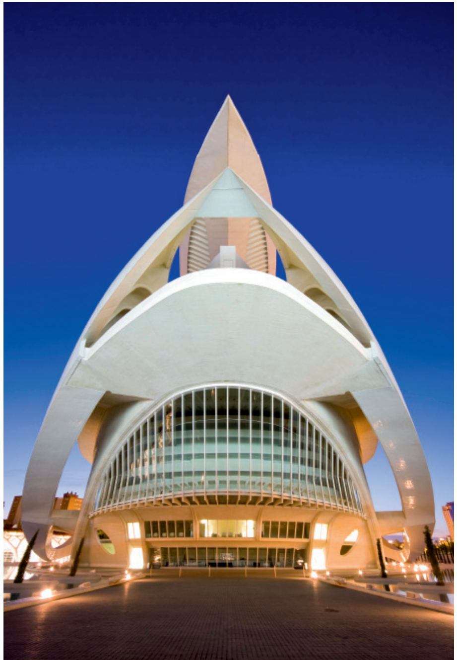
Fachada principal del Palau de les Arts Reina Sofía.

La programación es un cóctel a base de unos ingredientes similares en todas las temporadas, que pueden sintetizarse de este modo: la combinación