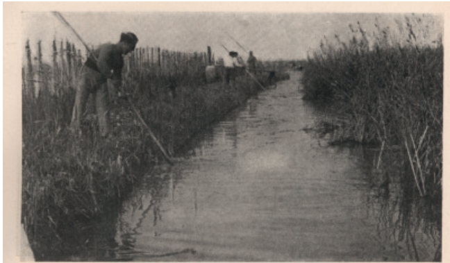
Consolidado el terreno se cubre de fango, que se extrae con azadas de mango largo.