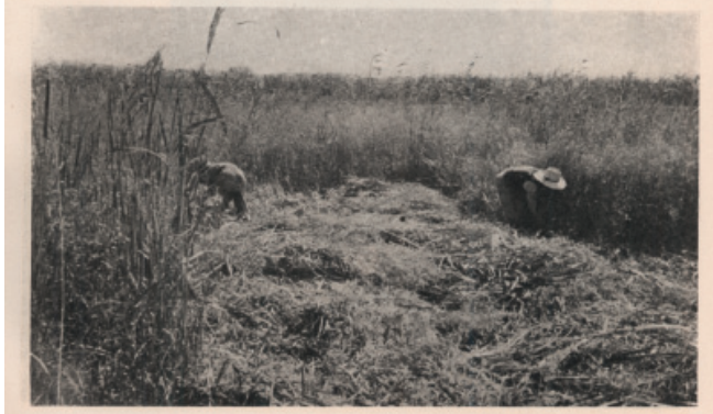
Realizadas las obras de defensa, se procede a rozar la extraordinaria vegetación espontánea.