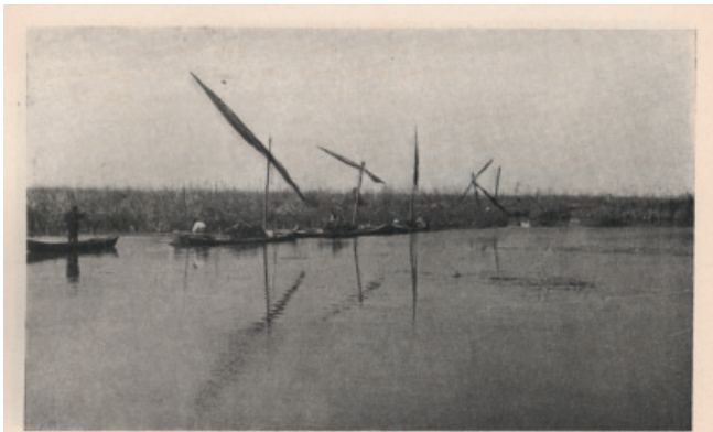
Una flotilla de barcas a vela acarrea la tierra para la construcción de los diques.