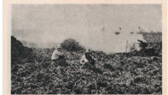
Los tocones, raíces y restos vegetales son destruidos por el fuego.

ción que tienen como objetivo reponer un buen potencial ecológico y un buen estado químico. No obstante no es fácil definir condiciones de referencia para humedales mediterráneos. Además los valores específicos de la Albufera, derivados de su relación ancestral con el hombre, dificultan la búsqueda de referencias válidas.