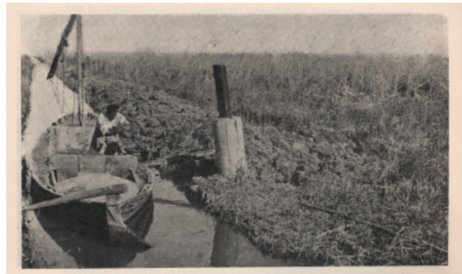
Después de rozar la faja donde ha de ir el dique o mota, se procede a la descarga de la tierra.