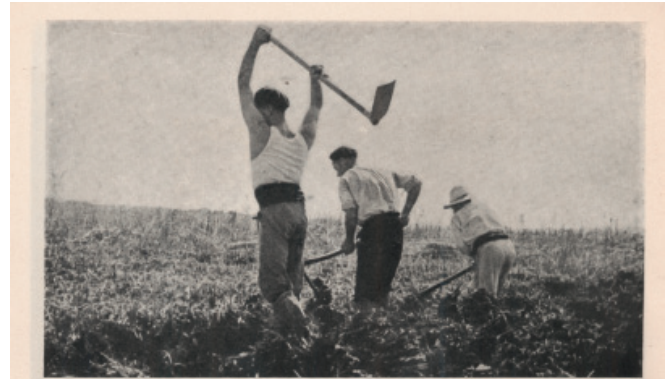
A cuya operación sigue la labor de roturación a brazo.