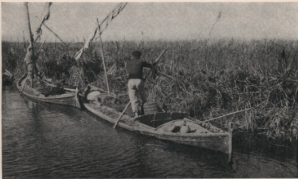
Sustituyen las velas por pértigas para situarse en los linderos de las parcelas.