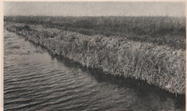
La tierra queda formando un lomo en toda la longitud.

arrozal, cuyas pautas históricas y de cambio ambiental en el entorno de la Albufera ha estudiado Sanchis (2001). En este proceso se construyen diques o motas que delimitan parcelas que se rellenan de tierra hasta alcanzar la altitud necesaria. El movimiento de tierra es extraordinario y el relleno de las parcelas, que oscila entre 0'25 y 2 m, significa un aporte terrígeno extraordinario a escala global. En las fotografías puede verse un ejemplo de transformación en el sector de la Mata de les Rates en arrozal (Mapa Agronómico Nacional n° 747, t. II, 1954).