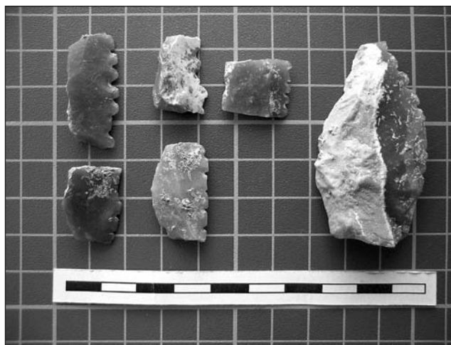
Làmina II. Elements de falç representatius de la col·lecció estudiada.

Pel que fa a les peces confeccionades sobre làmines-suports ( n = 6 ), dues són de sílex melat amb patina blanca i residu de còrtex —una d'elles té una dent fracturada. Les dues presenten un retoc simple, alternant i marginal a la zona denticulada i un retoc abrupte, directe i marginal a la zona de preparació per l'emmanegament. Les altres 4 dents de falç han estat elaborades amb sílex de diferents colors.