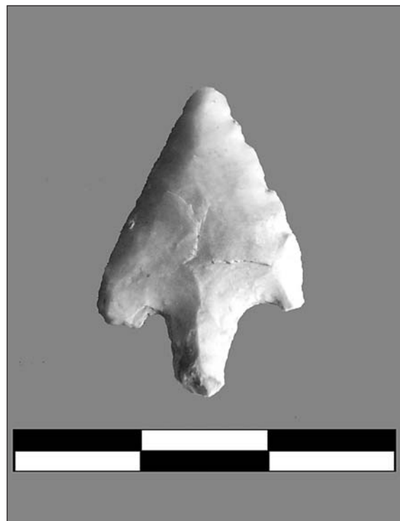
Làmina III. Punta de fletxa.

Una punta de fletxa de peduncle i aletes i cruciforme; a més a més, li falta un fragment de l'aleta esquerra; presenta un retoc pla, directe i profund. Aquesta s'ha realitzat sobre sílex lletós i té una pàtina de color blanc al voltant de tot el perímetre (lám. III).