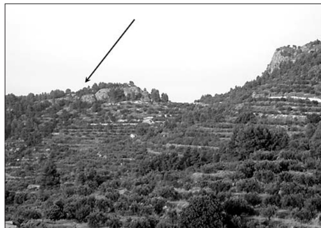
Làmina 1. Vista de la Mola des de l'oest.