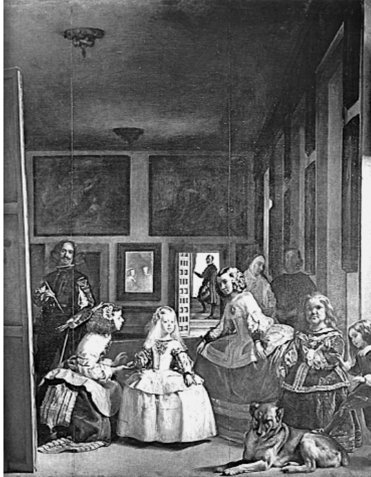
10. Jubón y basquiña sobre guardainfante. Las Meninas .

dos de cintura, lo que no tenían los primeros y que este religioso varón reheprende, que también eran anchos por la cinta como se colige de darles el nombre de caderas que es lo mismo que estos envaços, que oy llaman guardainfantes, polleras o enaguas cuyos nombres aún solos dan en que entender y que pensar a gente cuerda y prudente. Verdugos se llamaron al principio porque se hazian de varillas de mimbre con que antiguamente acotaban los verdugos a los facinorosos delincuentes y les daban el nombre de la caufa principal al instrumento.