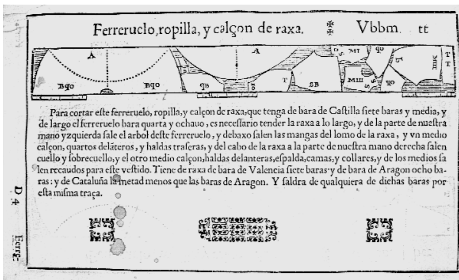
14. Calzón, ferreruelo y ropilla. Rocha. 1618.