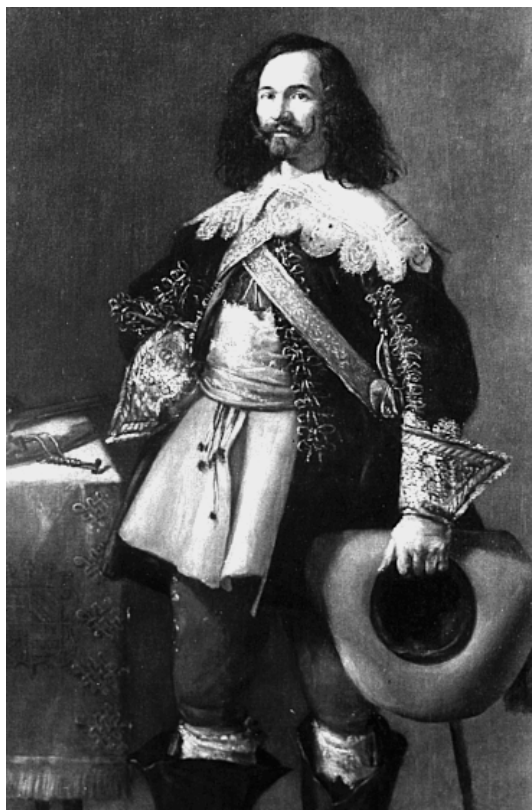
16. Traje de estilo francés. Casaca, chupa y calzón.

Se engalanan al estilo español Carlos II, el duque de Pastrana (Carreño de Miranda. Museo del Prado. Madrid) y don Bernabé de Ochoa de Chinchetru y Fernández de Zúñiga (Hispanic Society. New York. 1660).