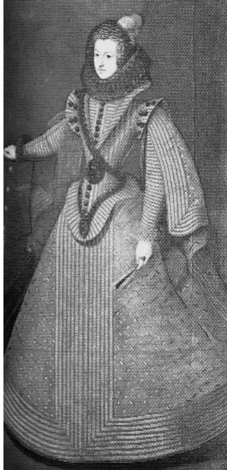
4. Cuera, jubón y basquiña. Reina María de Hungría. 1613.