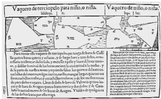
6. Vaquero de terciopelo para niño o niña. Rocha. 1618. Corteza del Museo Nacional del Traje. CIPE.

En la primera etapa de 1621-1636, las prendas de encima son la falda o basquiña, los vestidos: las