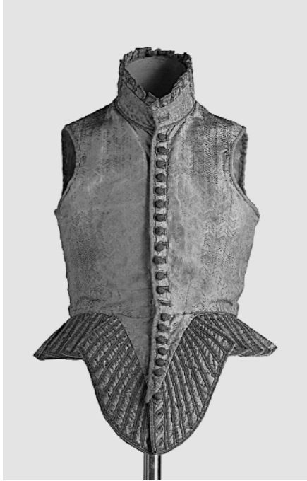
2. Jubón de seda, hacia 1580-1620. Museo Nacional del Traje.