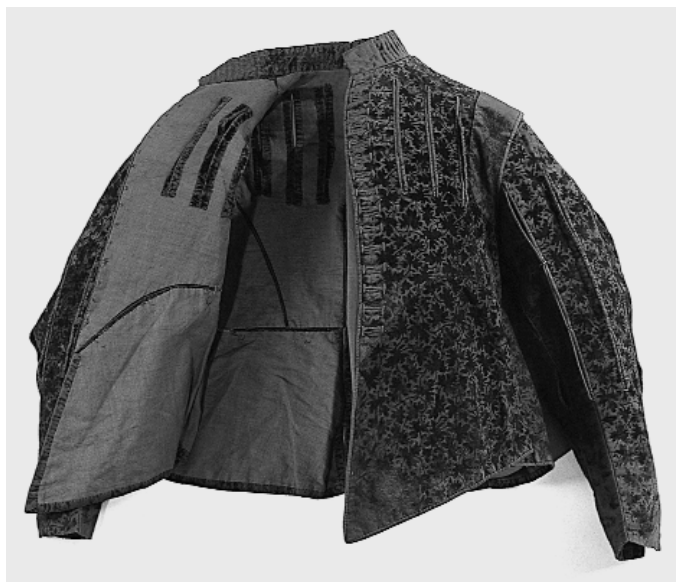
13. Jubón masculino. CEO 80298.

En este período, el estilo, más austero y sencillo que el de otros países, tiene una marcada predilección por el color negro, aunque no se descartan los demás colores. En el Renacimiento se rescata la atracción por el negro sentida por los grandes pensadores de la Antigüedad como Aristóteles, para quien dicho color era símbolo de estabilidad. Desde esa perspectiva de atracción por la oscuridad y por el color negro acaso se entienden que Felipe II (1527-1598) lo pusiera de moda en el traje, continuando llevándolo sus descen-