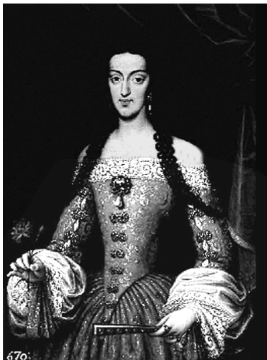
11. M a Luisa de Orleáns. Copia de J. Carreño de Miranda.

Durante el reinado de Carlos II (1665-1700), entre las prendas interiores femeninas destaca el uso del sacristán, estructura formada por una serie de aros sujetos unos a otros con cintas, que adoptó una forma circular, no tan ovalada como los últimos guardainfantes. Por tanto, cambió la silueta exterior femenina. El sacristán se llevó con gran número de faldas debajo y haciendo juego con la basquiña sin cola y la saya encolada. El pecho del cuerpo interior se siguió aplastando con cartones y ballenas. En el cuerpo exterior se usó el jubón, cuyo escote, en línea horizontal, descubrió los hombros y tendió a exagerarse. Con respecto a las mangas, en los años sesenta y setenta, la silueta de los brazos se engrosó. En los años ochenta se impuso un modelo exclusivo de la moda española (ajustada hasta más debajo de los codos, mostrando las contramangas formando un gran globo), que persistió a principios de los noventa. De jubones de esta época hay constancia en el Museo Nacional del Traje. CIPE. Un modelo de jubón es de