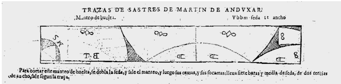
7. Manteo de vuelta. Andújar. 1640. Original en la Biblioteca Nacional. Madrid.