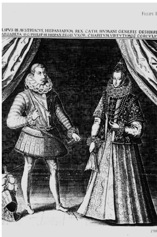
12. Traje de boda. Bodas de Felipe III y Margarita de Austria.

años noventa vuelve el pelo rizado, la onda desaparece y el peinado se hace más alto, con dos postizos colgando en los años ochenta y parte de los noventa.