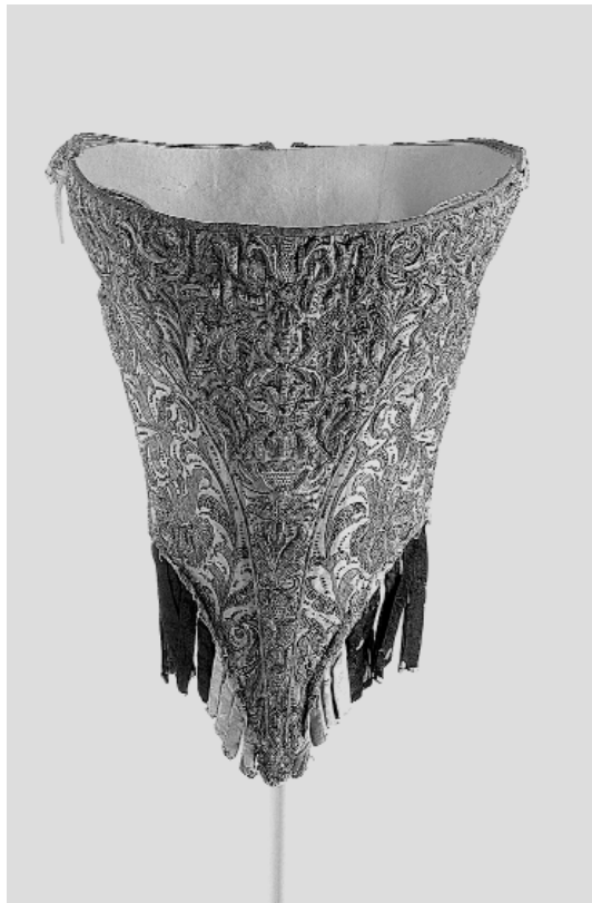
9. Jubón femenino en gros de seda. CEO 95516. Museo Nacional del Traje. CIPE.

(...) lo ancho y pomposo del traje que comienza con gran desproporción desde la cintura les prefta comodidad para andar emvarazadas de nueve y diez meses, fin que defto puedan fer notadas, principalmente las que ufan guardainfantes que de aquí dizen tomo el nombre efta diabólica invención, que junto con ella nos vino de Francia, donde es tradición que aviendo hecho preñada fuera de matrimonio una donzella de gran porte dio principio a efte traje para encubrir fu miferia y que con efto le dio