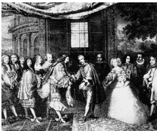
15. Encuentro de Luis XIV y Felipe IV en la isla de los Faisanes. Embajada de Francia en España.