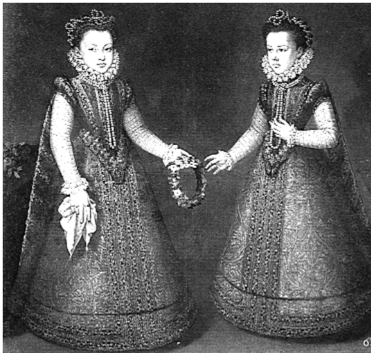
Las infantas Isabel Clara Eugenia y Catalina Micaela.

Como prenda de encima de la saya se vestía la ropa: vestidura suelta que traemos sobre la que está ceñida y justa al cuerpo . 17 En el retrato de Isabel Clara Eugenia luce una saya bordada en oro, se-