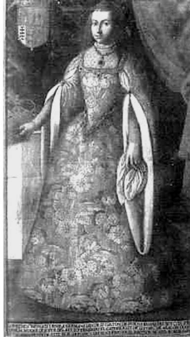
3. Saya con verdugado interior. Germana de Foix. 2ª mitad del s. XVI. M. B. A. Valencia.

ma ahuecador, el flamenco, consistente en un grueso rollo relleno de algodón que se colocaba a la altura de las caderas bajo el vestido. Como consecuencia, formalmente la forma exterior adoptaba la forma de un cilindro, las caderas se abultaban y hacían más redondas mientras que la falda descendía formando pliegues. De Francia este sistema pasó a Inglaterra. En España se adoptará el rollo de algodón flamenco en los años veinte del siglo XVII, pero no llegará a generalizarse. 12