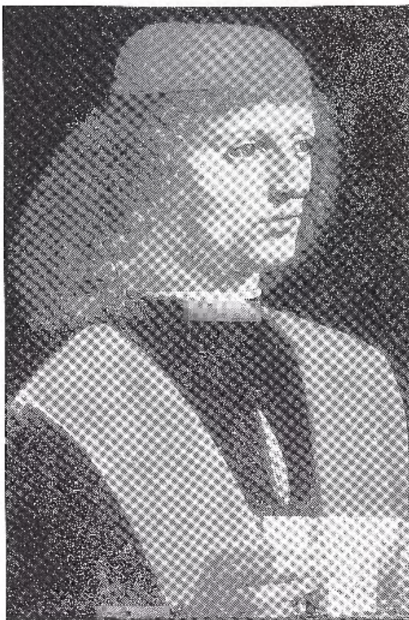
Leonardo da Vinci: Ritratto di Músico .

Rossi y Rovetta han querido asimismo ser fieles a la disposición sugerida por Borromeo en su Musaeum para su colección, que además marca el comienzo del actual recorrido por las salas. En torno a las salas federicianas se encuentran las obras adquiridas posteriormente y que corresponden a la pintura italiana de los siglos xv y xvi, donde además de las mencionadas obras de Leonardo y Botticelli encontramos magníficas piezas de Bramantino, Ghirlandaio, Pinturicchio, Viva-