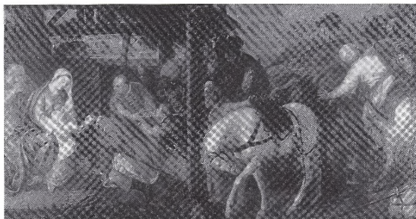
Tiziano: Adorazione dei Magi .