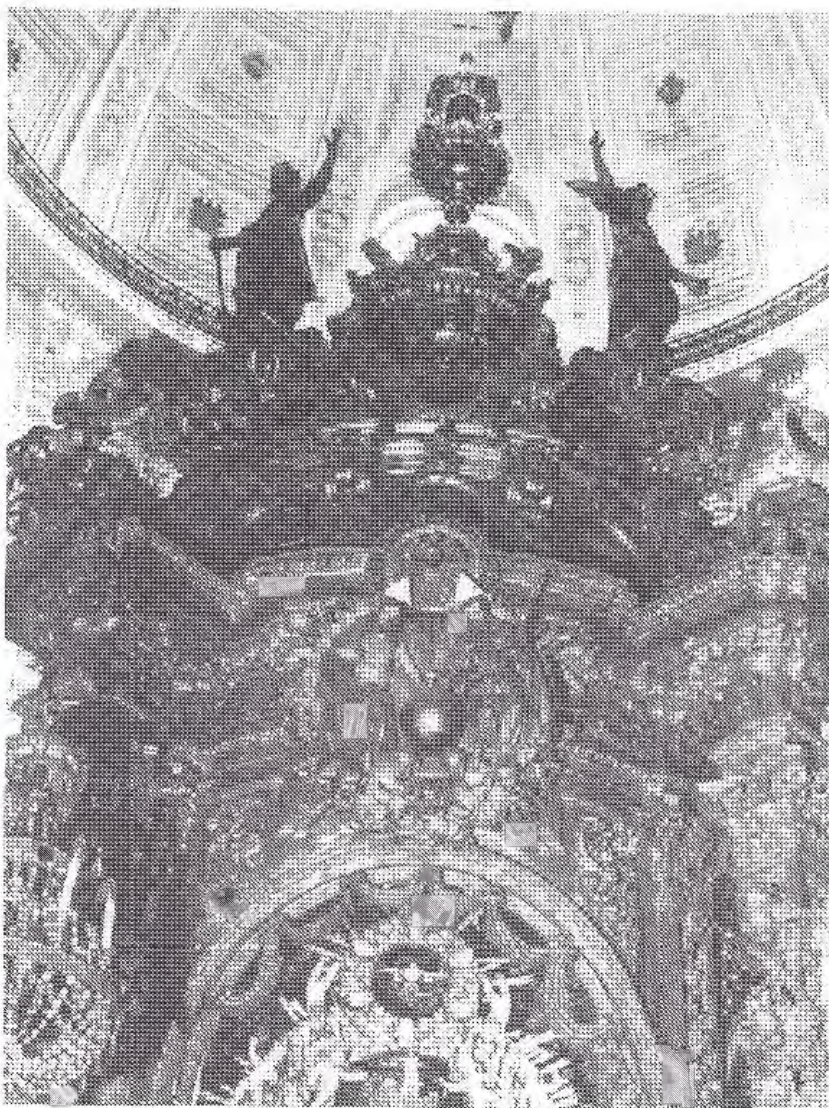
Fig. 1. Retablo de la Capilla de la Virgen de los Ojos Grandes. Lugo. Catedral.

angelotes. Conscientemente he empleado el término «triumfal» para definir este espacio ya que creo que es evidente para el planteamiento del retablo, pero sobre todo para la decoración simbólica de la capilla. Casas y Novoa se inspiró en el Triunfo que se levantó en la Catedral de Sevilla con motivo de la canonización del rey Fernando III el Santo. Esta arquitectura efímera fue prontamente conocida por la difusión del libro de la Torre Farfán 4 que sabemos poesía Fernando de Casas.