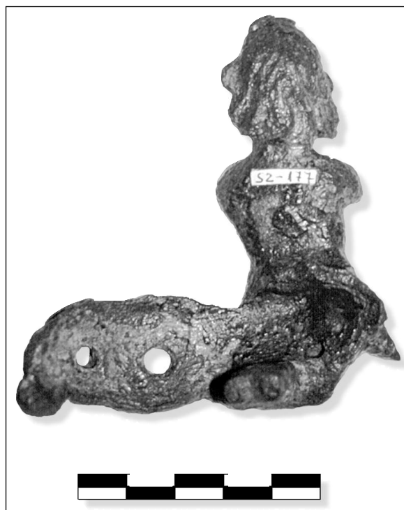
Fig. 2. Visión posterior de la pieza.