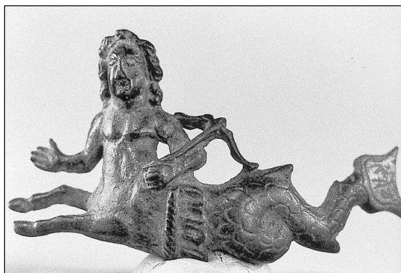
Fig. 4. Estatuilla de bronce de época romana (col. privada; LIMC, p. 52, 48).