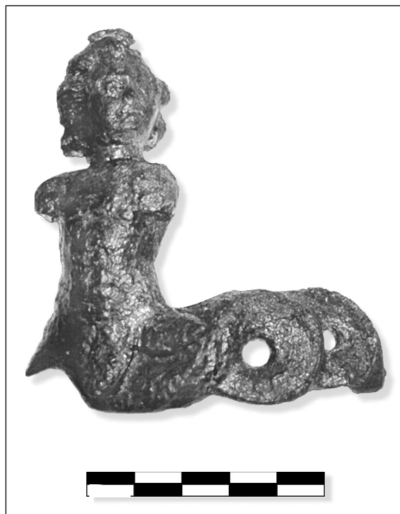
Fig. 1. El aplique de bronce procedente del foro de Sagunt.

Estamos ante la representación de una divinidad marina, como indican sus extremidades inferiores. No obstante, la identificación iconográfica de monstruos y divinidades marinas, sobre todo cuando no llevan consigo elementos distintivos, es difícil dado el parecido entre todas ellas en las extremidades inferiores a modo de cola de ser acuático: Nerea, Glauco, Forcis, Tritón... (Grimal 1982); creemos que es a este último a quien debemos reconocer en nuestra pieza, pues su representación es muy común en la antigüedad grecorromana, no lo siendo tanto las otras divinidades (Daremberg-Saglio 1919, p. 484).