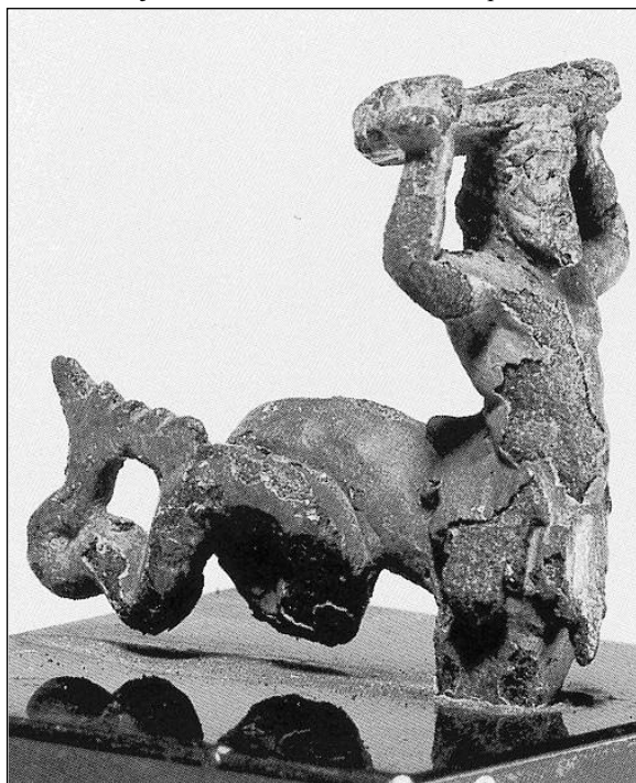
Fig. 5. Estatuilla de bronce de época romana (British Museum; LIMC, p. 52, 49).

Ahora bien, junto al efecto decorativo de la pieza debemos