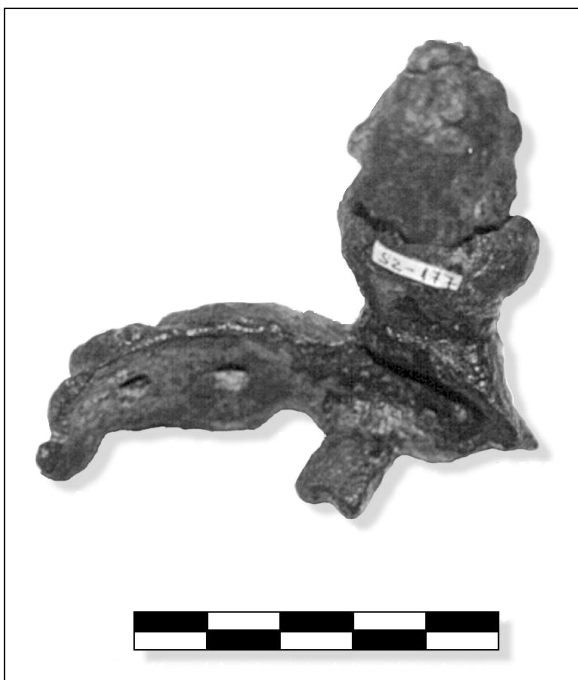
Fig. 3. Parte posterior donde se aprecia el vástago y la superficie de aplique de la pieza.

Generalmente se busca en Oriente el origen de los dioses-monstruos con cola de pez, aunque el tipo griego se ha atribuido a los acadios (Icard-Gianolio 1997, p. 72 y 83). Tritón, según la Teogonía de Hesiodo, es hijo de Poseidón y Anfitrite ( Teog. 930-933) y en tanto en cuanto es una divinidad marina, asiste a Poseidón en sus combates o en sus aventuras amorosas, e incluso ayuda a los Argonautas a llegar al Mediterráneo. Tritón es descrito como un ser monstruoso, mitad hombre mitad pez, cuya cola serpentiforme, escamosa y verde, es doble. Los atributos de Tritón son pocos: normalmente lleva un cetro, un pescado, un pequeño delfín o un tridente y debemos ver en él un personaje menor dentro de la mitología grecorromana, siempre cercano a sus padres (Icard-Gianolio 1997, p. 68 y 73).