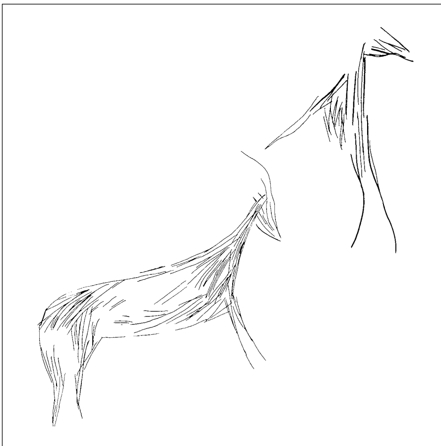
Fig. 2. Cáprido y prótomo de équido del panel central del Abric d'en Melià.

este procedimiento se consigue cierto volumen, aspecto que se observa en la mayoría de las figuras del abrigo. La distribución de los trazos parece delimitar la cabeza, el cuello, el pecho, el vientre, el anca y la nalga.