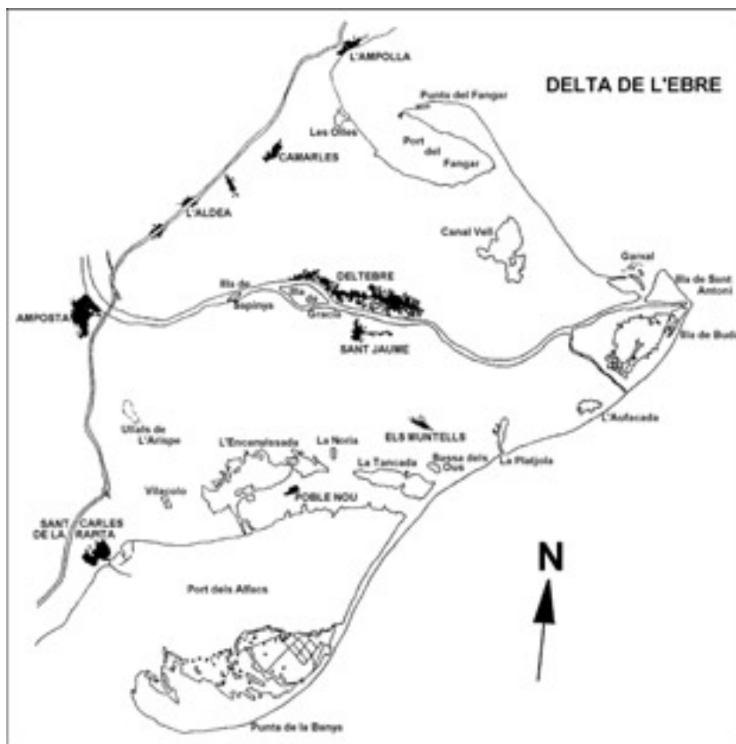
Figura 1.—Mapa de situación de la zona de reintroducción de Marsilea quadrifolia en el Delta del Ebro.

(Allsopp, 1952 in Tryon & Tryon, 1982) e incluso más de 100 años (comunicación personal del equipo de investigación del Conservatoire Botanique National de Porquerolles, Francia).