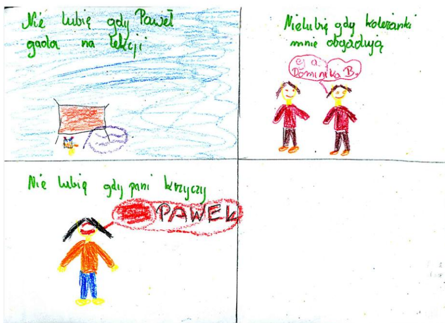
Przykłady rysunków uczniów i ich opisów