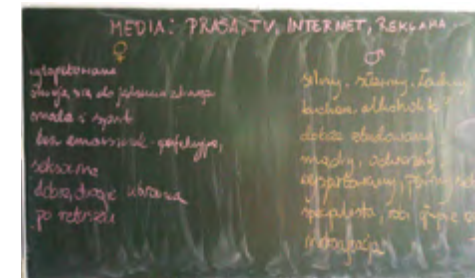
Edukacja seksualna w jednym z łódzkich gimnazjów

Istotnym aspektem dbania o bezpieczeństwo młodych ludzi w sferze seksualności jest problem pornografii. Jak wskazują wyniki badań 1 przeprowadzonych przez M. Jasińskiego w jednym z łódzkich gimnazjów, 100% chłopców i blisko 30% dziewcząt zagląda na strony o charakterze pornograficznym. Warto dodać, że wiek trafiających tam osób stale się obniża. Coraz częściej zdarzają się również przypadki uzależnienia od pornografii już u małych dzieci. „Zaczyna się zazwyczaj od tego, że dziecko wyszukuje w internecie informacje potrzebne np. do szkoły, wtedy przypadkiem natrafia na treści dla dorosłych: zdjęcia czy filmy erotyczne. Ogląda je i zaczyna się interesować, co to jest, skąd to jest, zaczyna klikać... Wchodzi na strony pornograficzne, widzi, że to wciągające, przyjemne, że to stymulacja, a tak naprawdę to początek uzależnienia. Mechanizm adaptacji, czyli przyzwyczajania się, sprawia, że dziecko szuka okazji, żeby tylko włączyć komputer, żeby tylko się zalogować, żeby coś pooglądać. Zobaczy jeden, dwa filmy pornograficzne, nasyci się, ale później już mu to nie wystarcza, ponieważ te same ▶