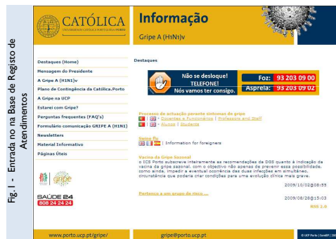
Fig. 1 - Entrada na Base de Registo de Atendimentos

Em conclusão, o desenvolvimento e actualização do site têm permitido eficaz articulação entre a equipa operativa do plano de contingência e os alunos, funcionários e docentes do CRP-UCP, tendo em vista o controlo da disseminação do vírus dentro da instituição.