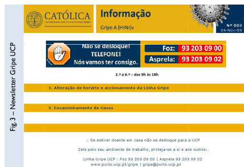
Fig. 3 - Newsletter-Gripe UCP