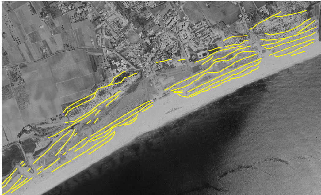
Figura 4- Principais cristas dunares da Praia da Manta Rota

A análise estereoscópica das diferentes fotografias aéreas possibilitou verificar o aparecimento e o estágio de evolução das cinco dunas frontais mais recentes (tabela 1) do sector este e dessa forma localizá-las temporalmente.