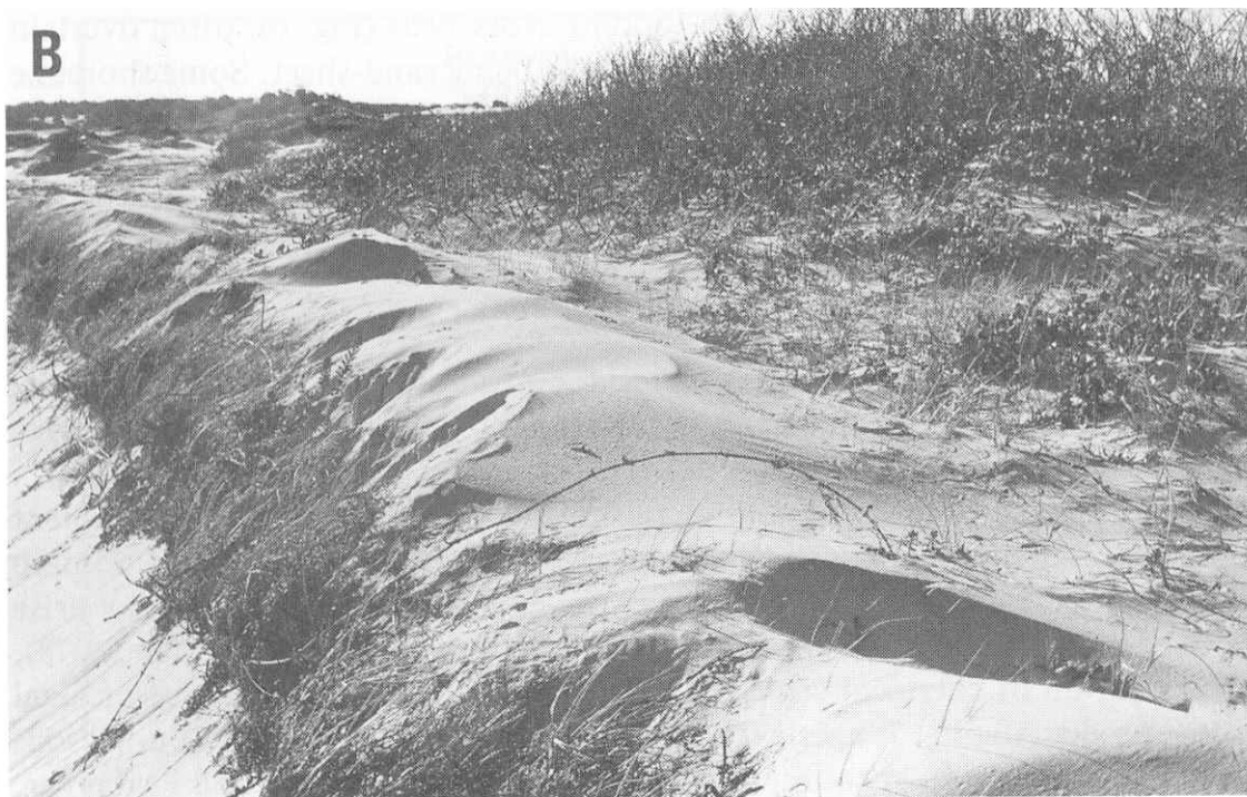
Figura 2 – Aspecto de uma duna frontal característica de um ambiente em erosão (adaptada de Carter et al,1990).

frontal mais elevada que as dunas que estão para trás. Também a vegetação se apresenta de uma forma distinta verificando-se a coexistência espacial de espécies de elevado crescimento vertical com espécies que apreciam ambientes mais calmos, uma vez que superfície da duna antiga está a ser coberta por areia arrancada à escarpa (figura 2).