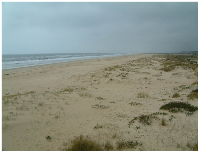
Figura 1 – Aspecto característico de uma duna frontal formada numa praia em acreção: Sector este da Praia da Manta Rota.

Se o crescimento da praia se processa por episódios de acreção alternando com períodos de estagnação, então forma-se uma sucessão de dunas frontais bem individualizadas. A altura e largura das dunas dependem do transporte eólico mas também do intervalo de tempo entre cada episódio de acreção. Em ambos os casos a transição duna/praias é suave e a vegetação está bem zonada (figura 1