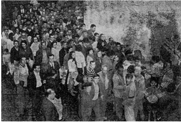
Fig. 4: Afluência à Fonte das Ratas, no auge da sua popularidade (foto retirada do Diário Popular, de 20 de Outubro de 1963, [11]).

A popularidade da Fonte das Ratas, que, de acordo com a crença popular “tinha múltiplas virtudes terapêuticas” e cuja reputação curativa da água se espalhou rapidamente, atingiu o auge em 1963/64, em que milhares de pessoas se acotovavam e esperavam horas para encher os seus garrafões de água, ao ritmo de cerca de 360 garrafões/hora, abrاندando apenas entre as 3 e as 5h da manhã (ver figura 4).