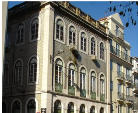
Fig. 3: Edifício das antigas Alcaçarias do Duque.

Foram as termas das Alcaçarias do Duque que tiveram maior longevidade, persistindo até 1978, altura em que foram declaradas irremediavelmente inquinadas e abandonadas.