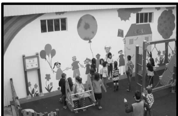
Figura 2. Mural da não violência escolar

Pintar o mural foi a atividade que mais despertou o interesse e o empenho das crianças. De salientar a reação extremamente positiva das crianças e das pessoas ligadas à instituição, encarregados de educação e familiares. Além disso, Todas as crianças queriam participar nas “pinturas” e, ao fazê-lo, a primeira reação era chamar os seus familiares para verem o “bocadinho” que tinha sido pintado por eles. Foram muitos os comentários que referiam que o mural tinha sido muito bem conseguido, que o espaço tinha ganho muito com a sua realização, tinha ficado mais acolhedor, mais alegre e mais simpático (cf. Figura 2).