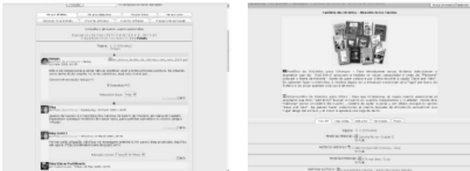
FIGURA 5 Para Intercambi@r...

Aquí encontramos diversas bases de datos, tales como “Material para preescolar”, este recurso está disponible con contenidos diversificados. Esta herramienta permite la introducción de archivos para quienes son administradores en la comunidad. Nos pareció que esto podría servir de apoyo al intercambio si los archivos fueran enviados al investigador responsable de la comunidad @rcaComum; con el transcurrir del tiempo este recurso pasó a ser menos utilizado pero aún contiene toda la información que se introdujo desde su inicio.