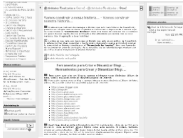
FIGURA 8 Actividades realizadas y otros

Otra sección que sirve de apoyo y divulgación de herramientas tecnológicas es la que llamamos de “Programas gratis” (figura 9) donde divulgamos programas informáticos que pueden ser instalados gratuitamente en las escuelas, destinados a niños y educadores.