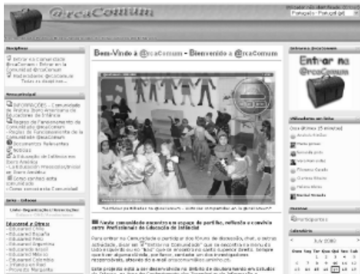
FIGURA 1 Página principal @rcaComum