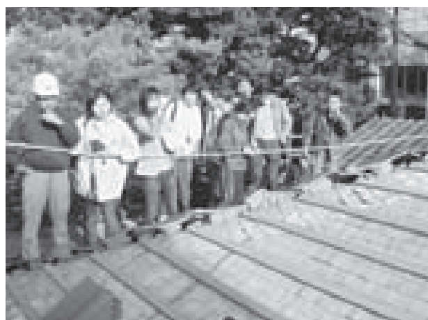
図-4. 安田邸の修理工事途中で瓦を下した屋根を見学

安田邸の管理運営は、現在JNTからたてももの応援団に委託し、安田邸をこよなく愛するメンバーらによって、創意工夫に満ちた活動が展開されている。市民による身近な文化遺産の発見から始まった安田邸の保護活動は、歴史的建造物の保存・活用に取り組む全国各地の市民団体や行政から、モデルケースとして知られるようになっていく。