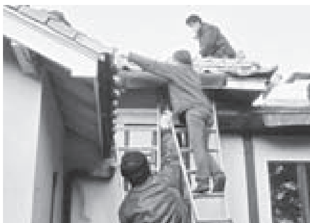
図-8. 地元建築士らによる応急修復（旧モーガン邸）

を得ない。そこでJNTでは、ナショナル・トラスト型の保護事業に加えて、地域の歴史的環境保全に取り組む市民活動を支援するシビック・トラスト型の支援事業も活動の主要な柱に位置づけている。自然や歴史をいかしたまちづくりの拠点である「ヘリテイジセンター」の整備や、共通テーマをもとに、各地の市民団体や行政が取り組む保護活動をつなぐネットワーク支援がそれにあたる。