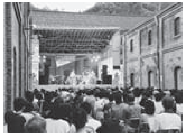
図－3. 舞鶴の赤煉瓦建造物群 ii) （京都府舞鶴市）