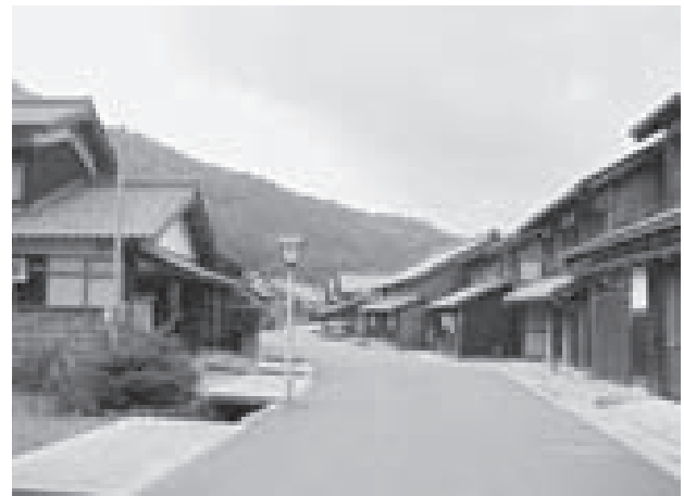
図－2. 熊川宿の町並み 1) （福井県若狭町）

活動の基本となる観光資源保護調査は、昭和47年から開始し54年からは公募形式として実施してきた。対象は、民俗芸能、歴史的建造物や町並み、自然景観、動植物、産業遺産などさまざまな分野にわたるが、とくに歴史的町並みを対象にした調査が多く、その後文化庁の伝統的建造物群（伝建）保存対策調査につながり重伝建地区に選定された例も少なくない。また、会員や地域住民、子どもたちの参加によって実施した調査もあり、調