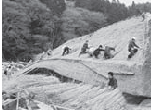
図-10. 残った茅葺き屋根を解体保存するボランティア