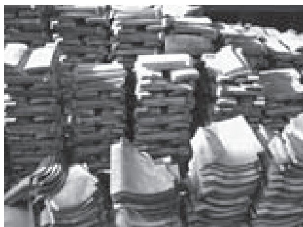
図-5. ボランティアで洗った瓦の山