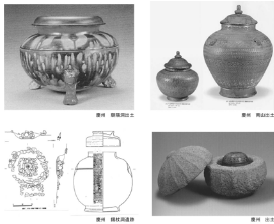
図3 新羅の火葬墓（王京周辺）

施設という入れ子構造をとる点は、日本の群火葬墓と共通し、舍利容器に見られる入れ子構造が反映しているものと考え、仏教思想を基調とする思想が火葬受容の背景に共通した存在していたと考えた。