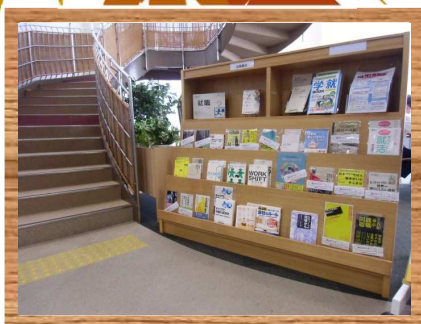
現在の企画展示 お題「就職について」

就活本だけではなく、「働く」ということに視点を当てた本や、数年後を見据えた学生生活の送り方の本などもあります。就活これからの人も、まだまだ先という人も一見の価値あり。