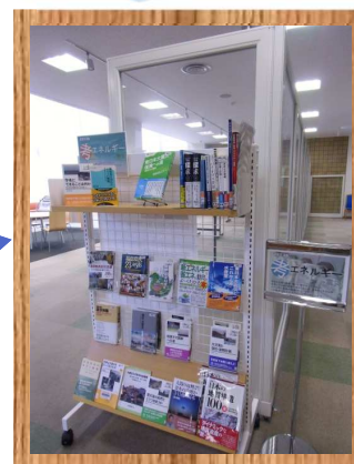
現在の企画展示 お題「考エネルギー+震災」

昨年の震災を契機に身近になった『エネルギー問題』「何となく」知っているという人は多いのでは。ぜひこの機会に、「何となく」から少しでも脱してみても併せて、震災関連の本も置いてあります。