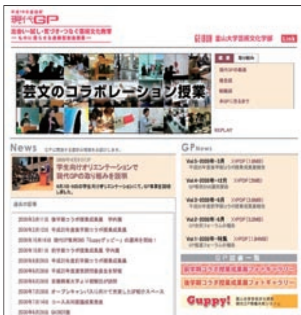
写真7 GPwebのトップページ

とを目指した。加えて、SNSやGP図書に関する情報を流し、本事業の情報を提供する場として機能させた。この大型モニターの管理体制には、放映データを通信で配信できるシステムを導入し、GP事務局にて一括管理した。そうした中で、徐々に、同モニターの利用を希望する声が聞かれるようになったため、アンケート箱を設置し広く要望を収集するとともに、次年度以降の利用方針をコンセント委員会において検討した。