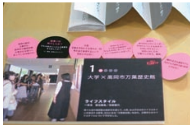
写真4 学生アンケートのコメント利用の様子