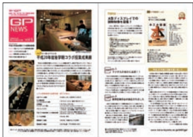
写真8 GPニュースレター

主にコラボ授業の学生・教職員そして連携先関係者との情報共有を目的としたSNS（通称「Guppy!」）は、20年度前期にシステムの試行・改良を終え、後期から本格運用を開始した。運用開始に先立って、学生向けの説明会と教員向けの講習会を開催し、SNSの利用方法を