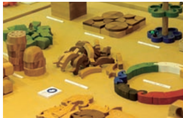
写真5 学生が制作した木のおもちゃ作品