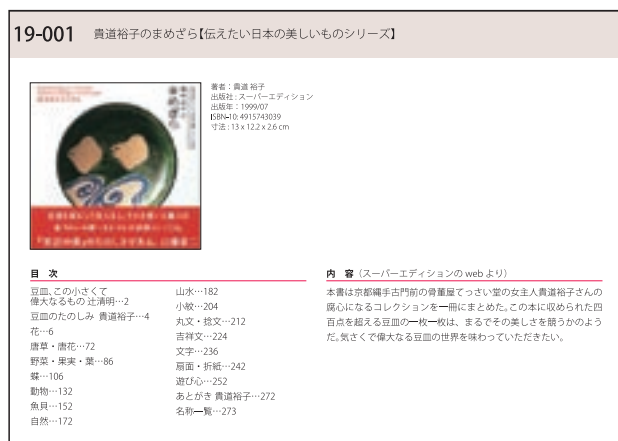
写真9 GP 図書リスト

携帯型展示台や見本棚の制作設置に加えて、学内における展示照明設備の充実を図った。既存の照明は、主に卒業制作展等の大規模な展示企画が想定され、展示空間も限られているという問題があった。一方、本事業では各授業単位での展示を想定しているため、小規模展示にも対応できる照明の導入が必要となった。そこで学内7箇所に、照明ダクトレールを取り付け、調光可能なスポッ