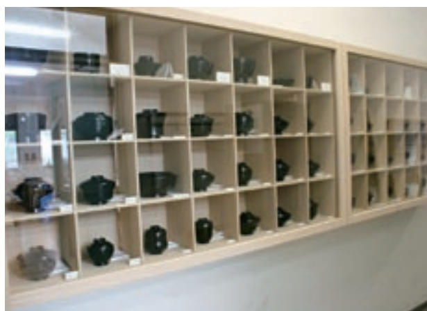
写真13 漆碗の見本展示棚

に共有することはなかった。そこで、平成20年度の本事業では、70種類に及ぶ漆碗の見本、螺鈿の見本手板50枚、変わり塗り見本手板50枚、金工のナイフ制作工程見本、木工の削り物制作工程見本、薄肉レリーフ制作工程見本を展示する棚を制作した。これらの見本棚は、学内を通行する多くの学生や教職員が、日常から目にするところのできる場所に設置した（写真13）。