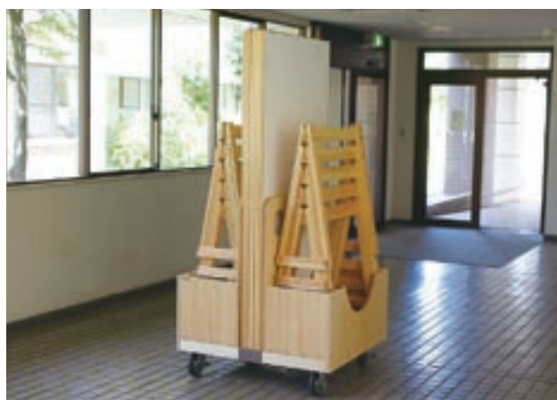
写真11 収納時の携帯型展示台