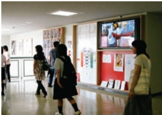
写真6 学内大型モニター

情報の提供と共有を目的として、平成19年度末に3台の大型モニターを学内3か所に設置した（写真6）。平成20年度にはこれらの大型モニターで、コラボ授業の記録を編集放映し、履修学生のみならず多くの学生及び教職員が連携先の様子や外部講師の言葉を共有するこ