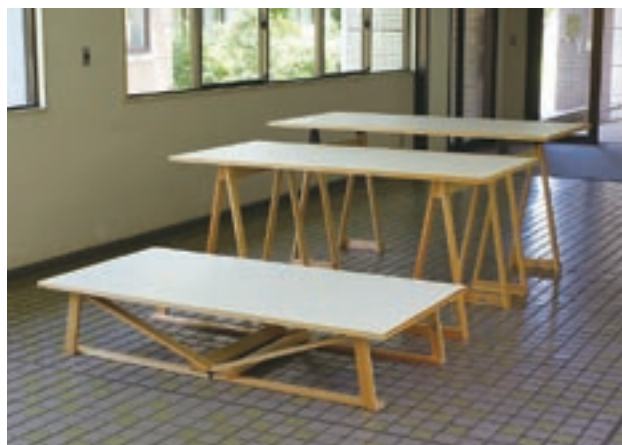
写真10 3段階の高さに調整できる携帯型展示台

また、可視化のための環境整備の一環として、加工見本展示棚の制作を行った。これまでも芸術文化学部では、金工、木工、漆工、デザイン等の分野で、技術解説や発想を導くための見本を様々な形で可視化してきた。しかしこれら可視化された教材は、限られた場面で使用されるだけで、関係者以外の学生や教職員が日常的