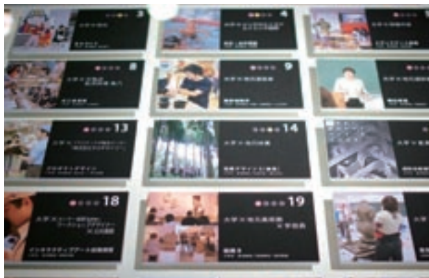
写真3 展示に用いたコラボ授業一覧パネル