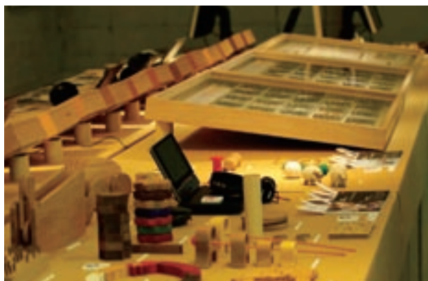
写真2 コラボ授業成果展の展示風景