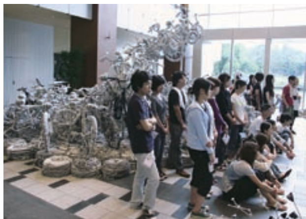
写真15 「デニムの耳プロジェクト」

1月には、大学における大学教育改革プロジェクトの取組状況についての調査をするため、「大学教育改革プログラム合同フォーラム」(主催：文部科学省、財団法人文教協会、会場：パシフィコ横浜)に参加した。同