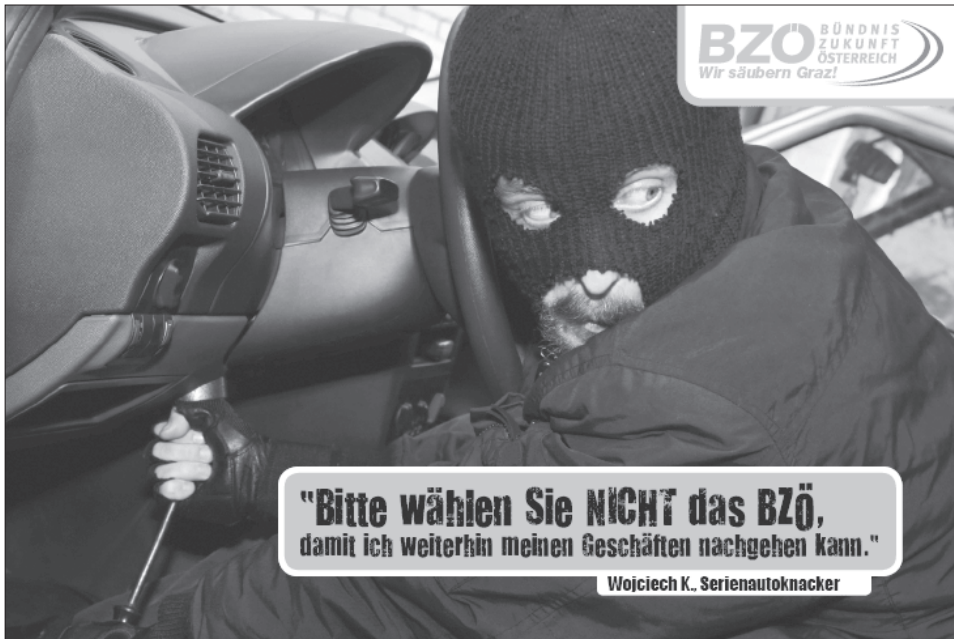
Abbildung 2: BZÖ, E-Card/Elektronische Postkarte »Serienautoknacker«

Quelle: http://www.sauberesgraz.at/postcards/card_kriminell.gif , 9. 11. 2007