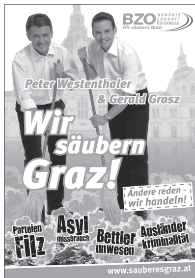
Abbildung 1: BZÖ, Graz-Kampagne Aufsteller