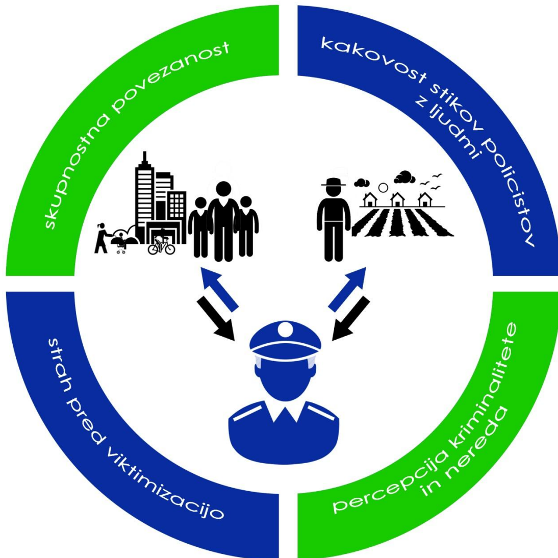
Slika 2: Policijsko delo v skupnosti glede na ruralno in urbano okolje (Vir: Lasten)

Primer policijskega dela v lokalni skupnosti, ki ga je predstavil Fleisner s sodelavci (1992). Z namenoma reševanja problemov v skupnosti so, kljub velikemu skepticizmu pristašev klasičnega policijskega dela, poskusno uporabili v skupnost usmerjeno policijsko delo za soočanje s perečimi problemi v skupnostih. Način dela in patroljiranje je policija v določenih mestih spremenila. Občani so policistom pristopili na pomoč in jih obveščali o problemih jim pomagali pri identificiranju problemov. Prizadevanja za boj proti drogi so pripeljala do sprememb pri javnih telefonskih aparatih, kjer ni bilo več mogoče sprejemati klicev ter s tem onemogočili naročila prekupčevalcem drogo, odprli so telefonske linije za obveščanje o krajih razpečevanja droge in dosledno izvajali določila odlokov o javnem redu. Poleg tega so začeli izvajati akcijo proti grafitom, zagotavljali so večerno rekreacijo za