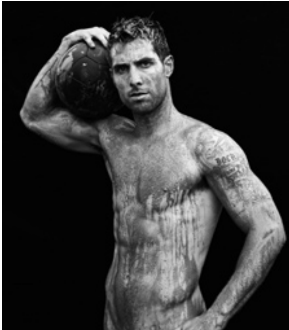
Figura 2. La consideración del deportista como ídolo de masas coexiste con la “puesta en valor” de su propio cuerpo, transformando el concepto clásico del ideal atlético en el más “comercial” de reclamo erótico o sex-symbol . Así se advierte de esta fotografía de Richard Phibbs del futbolista Carlos Bocanegra para la edición especial de ESPN, The Body Issue 2012 .

cialmente por los más jóvenes 13 . Sin embargo, a raíz de su conversión en ídolo de masas, el deportista asume un rol diferente en calidad de fetiche y reclamo al servicio de la propaganda institucional, el consumo y los intereses creados en torno al mismo 14 . Ello implica –y sin que tenga por qué ser necesariamente negativo– que su cuerpo se encuentre automáticamente “en venta”, al ponerse en valor en muchos casos no tanto su carisma personal o los méritos de su esfuerzo y trabajo, como lo más sensual de su anatomía 15 . (Fig. 2)