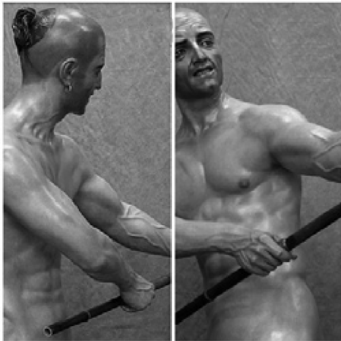
Figura 7. Sin duda, una de las obras maestras de la imaginería procesional del siglo XXI, además de altamente arquetípica del neobarroco gay, es el conjunto de figuras del misterio del Cristo Atado a la Columna de Martos (Jaén), obra de Francisco Romero Zafra en 2008. El triunfo de la anatomía musculada y poderosa “conquistada” en el gimnasio y ponderada por la mirada homoerótica constituye su mejor carta de presentación estética.

realistas” que parecen haberse impuesto en la imaginería procesional del siglo XXI, ambos autores pasan por ser los auténticos creadores del neobarroco gay por varios conductos. Esto es, ya sea mediante la androginia morbosa aplicada a algunas representaciones de personajes jóvenes (San Juan Evangelista o sayones, por ejemplo), como especialmente a una serie de figuras de personajes secundarios (soldados romanos, sayones...) ejecutadas para distintos misterios procesionales de Córdoba, Montilla, Martos, Zafra y de otros puntos de Andalucía. Además de una ejecución técnica impecable en modelado, talla y policromía, en todas ellas sobresale la espontaneidad en el tratamiento de las expresiones gestuales, sumada a la frescura hedonista a la hora de explorar la sensualidad del cuerpo masculino desnudo en todo su esplendor de fuerza y vigor muscular y haciendo gala de un inequívoco deleite voyeur . Y ello, por no hablar del sugerente decadentismo, de signo un tanto “canallesco”, aplicado a la descripción obsesiva y caracterización morbosa de los elementos personalizadores del cuerpo: tatuajes, piercings y tratamientos capilares. (Fig. 7)