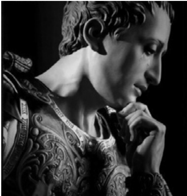
Figura 6. La subversión del género puede comprobarse en la imagen del centurión Longinos (2010-2011) para la Hermandad del Descendimiento de Cabra (Córdoba). El resultado supone una absoluta feminización de la masculinidad convencional, al desafiarse y cuestionarse claramente la habitual imagen de la virilidad inherente a la representación de un militar romano.