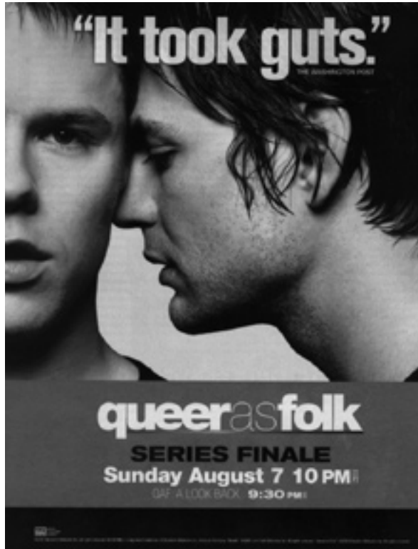
Figura 3. La serie televisiva Queer as Folk aborda sin censura y con franqueza, el estilo de vida de los homosexuales urbanos de clase media. Su acertada combinación de drama, humor, y sexo ha contribuido, desde su emisión a partir del 2000, a “normalizar”, visibilizar e incluso popularizar el mundo gay entre el público en general.

en última instancia, la escultura convierte en plasmación tangible y morbosamente fascinante de una atracción y un deseo homoerótico ya sea desinhibido, prohibido, oculto, latente, reprimido, emergente o explícito.