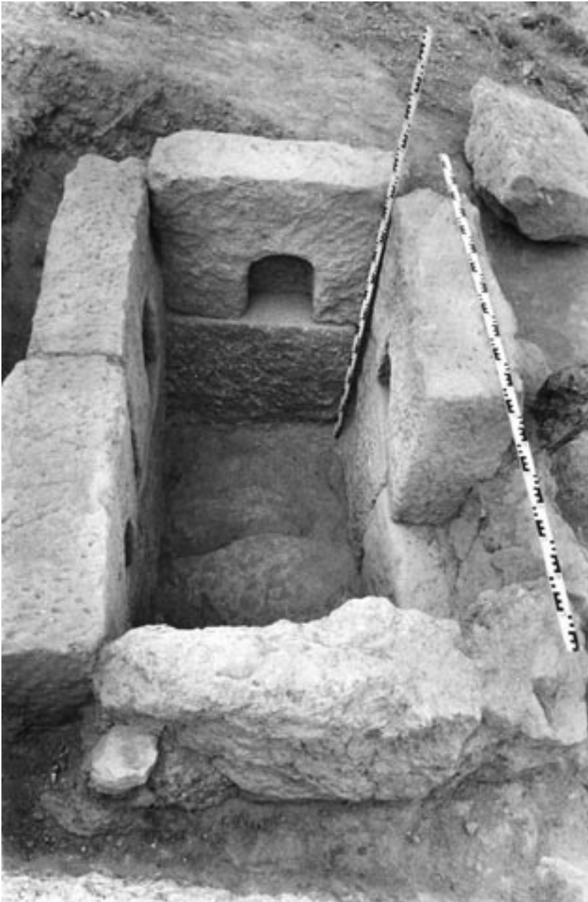
1. Tumba de planta rectangular con cinco loculi descubierta en la ciudad romana de Singilia Barba