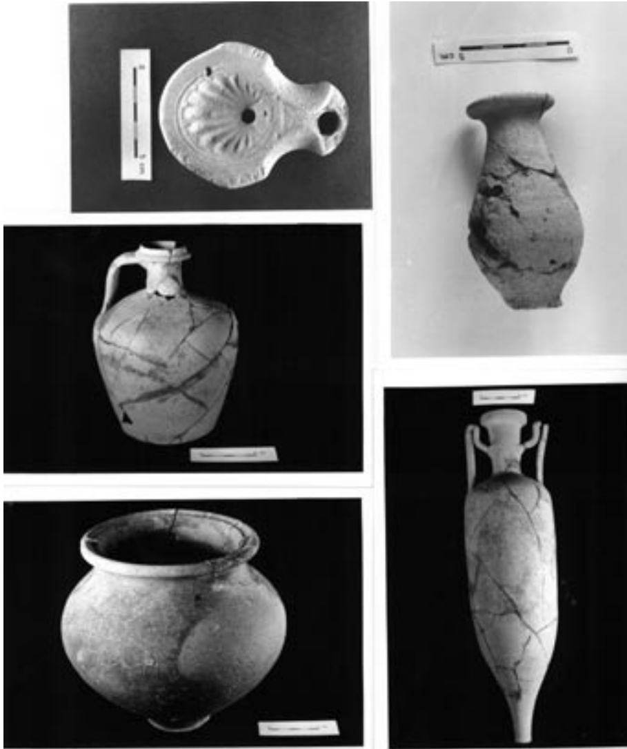
3. Ajuar funerario de la tumba de inhumación