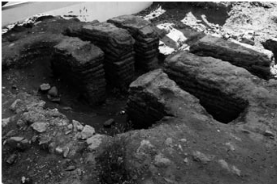
Horno altoimperial del yacimiento Faro de Torrox (Torrox-Costa).