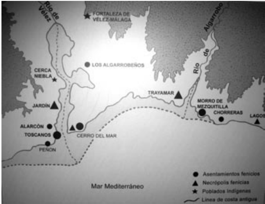
Mapa con los yacimientos fenicios de la costa de Vélez-Málaga.