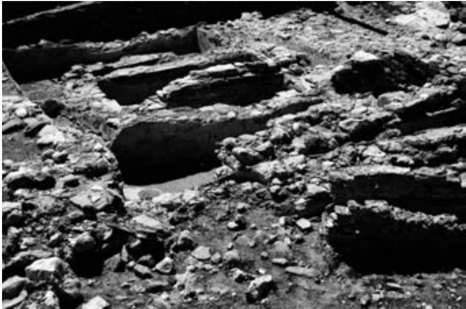
Factoría del Faro de Torox, posteriormente reutilizada como mecrópolis.