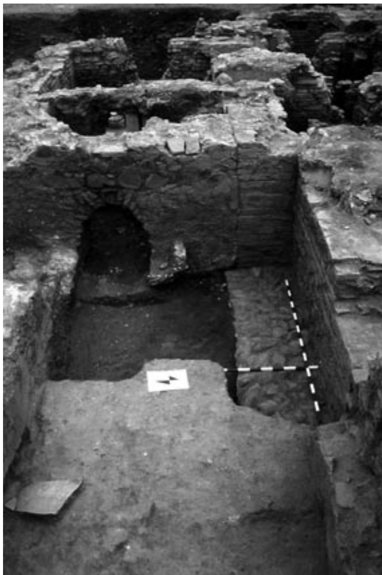
Termas de Benagalbón.