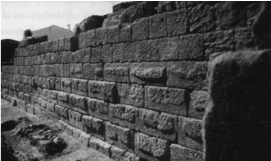
Muro romano de Toscanos (Vélez-Málaga).