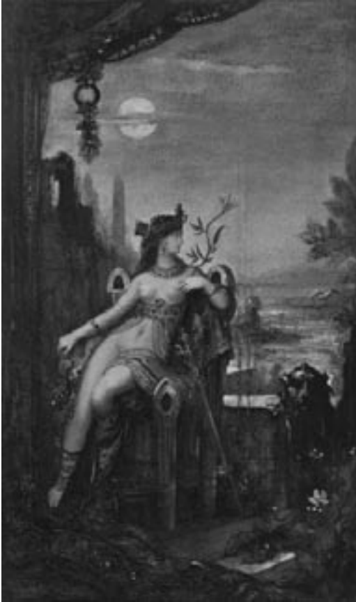
12. Gustave Moreau, Cleopatra , 1887.