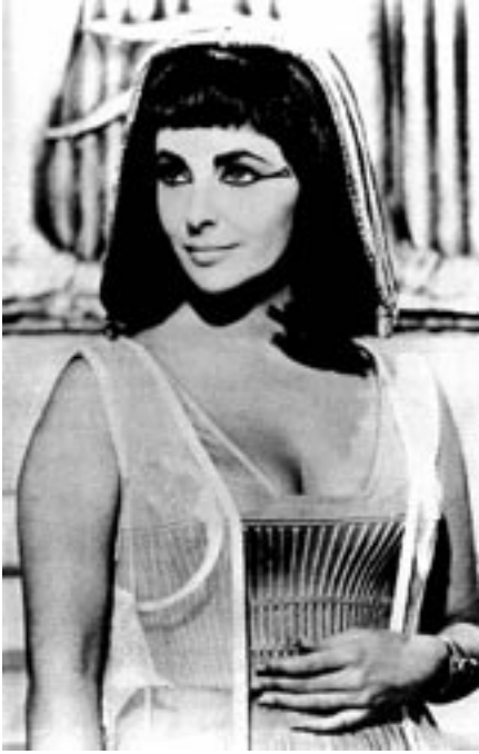
16. Liz Taylor en Cleopatra , 1963.

en las sucesivas escenas, en las que gana en sensualidad para atraer a César o actuar como soberana hablando de asuntos de gobierno o recibiendo audiencias. Todos advierten la metamorfosis: “eres lo que los romanos llaman una mujer moderna”, elocuente opinión que, dado el tono general del texto, bien podía responder a la mordaz sátira de las condiciones asociadas a la modernidad femenina.