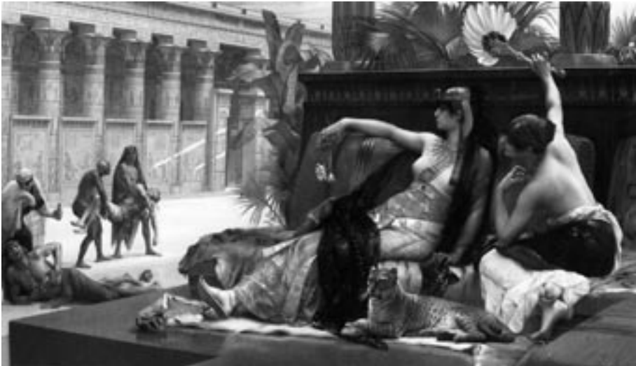
11. Alexandre Cabanel, Cleopatra ensayando el veneno con sus amantes , 1887.

El siglo XIX trajo además una nueva visión plástica del mito. La comprensión de la fuerza visual de la soberana propiciará el tratamiento de su figura en la plenitud de su poder, sin necesidad de aditamentos escenográficos,