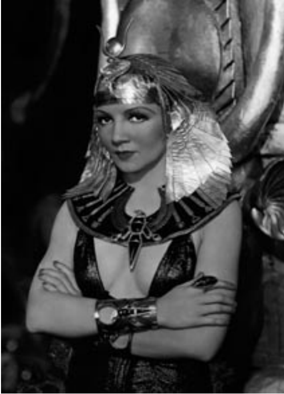
14. Claudette Colbert en Cleopatra , 1934.

Igualmente la puesta en escena 45 , apoyada en una ambientación y mobiliario Art Déco , se pone al servicio de la consecución sensual. Un derroche de escenas eróticas, en las que los movimientos estaban coreografiados hasta el detalle 46 , y una corte de burbujeantes flappers , ayudan a crear la atmósfera buscada. Algunos de los elementos de atrezzo hacen referencia explícita a este carácter. Es el caso del lecho en el que la reina recibe a Julio César, adornado con dos leonas aladas y dos largos tallos de loto cerrado de clara asimilación fálica. En este sentido, en una de las escenas de mayor contenido erótico, se recurre a la desacralización y per-