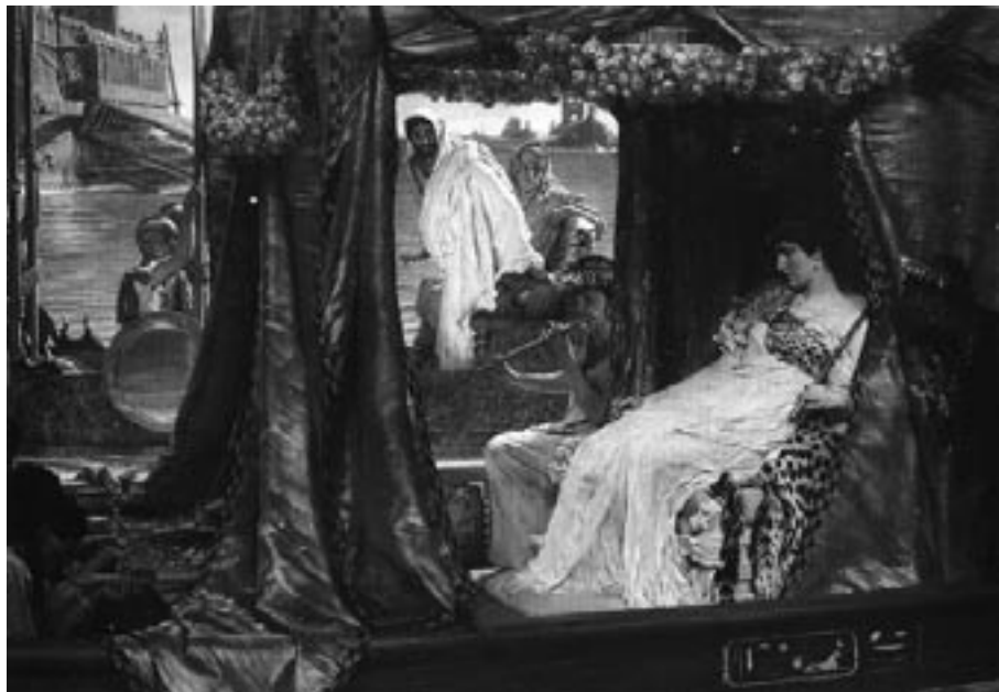
10. L. Alma-Tadema, El encuentro entre Antonio y Cleopatra , 1883.

sus deseos morbosos al poder contemplar un cuerpo femenino desnudo que se ofrecía sin resistencia.