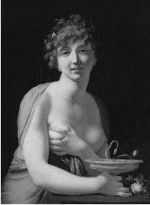
8. Jean-Baptiste Regnault, Cleopatra , h. 1790.