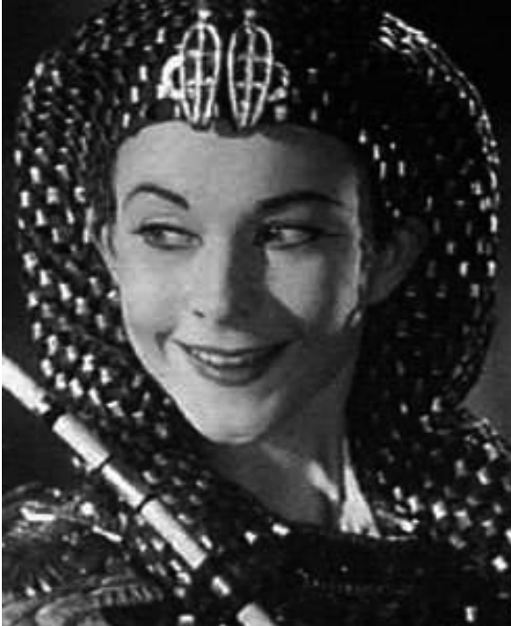
15. Vivien Leigh en César y Cleopatra , 1945.

Mucho más rico en matices es el perfil que se ofrece de la reina de Egipto en César y Cleopatra , adaptación cinematográfica, rodada a las órdenes de Gabriel Pascal en 1945, de la obra teatral de George Bernard Shaw, quien trabajó asimismo en el guión. Vivien Leigh da vida a una menuda y nada exuberante Cleopatra, educada para ser reina por César (Claude Rains) que actúa como pigmalión. El físico de la actriz y sus soberbias dotes interpretativas resultan claves en la caracterización del personaje creado por Shaw, preocupado por mostrar los diversos componentes del estereotipo femenino encarnado por la soberana egipcia [fig. 15]. La esencia dual se pone de manifiesto en la transformación física y moral que sufre la protagonista. Esta Cleopatra-Lolita, una inocente niña juguetona, caprichosa y malcriada, “divina criatura” “niña