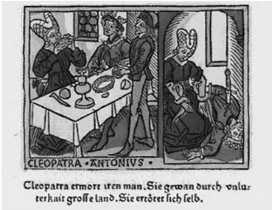
1. Cleopatra. Ilustración de un manuscrito de Bocaccio, 1405.

Tras el vacío iconográfico medieval, serán los cambios ideológicos, filosóficos y estéticos, y el conocimiento de los escritos clásicos, vinculados al humanismo renacentista, los que hagan resurgir el interés por el personaje. La pareja de amantes, Antonio y Cleopatra, co-protagonizan la mayor de las imágenes de la primera mitad del siglo XV. El episodio escogido sienta las bases de lo que será en el futuro el tratamiento prioritario del tema: el suicidio y la muerte, planteado de manera simultánea o, al menos, en la misma escena. Una ilustración para un manuscrito de Bocaccio, fechada hacia 1405, muestra a Cleopatra en el momento previo al fatal desenlace, anunciado por las picaduras de las dos serpientes que se enrollan en los brazos, mientras que Antonio yace muerto a sus pies [fig. 1]. Mucho más impactante resulta la interpretación del mismo asunto en una pintura anónima de 1450 [fig. 2]. Pero las dimensiones trágicas del luctuoso hecho no están planteadas con el mismo nivel de intensidad para los dos personajes, ni se acogen a la misma posición de partida, por lo que los resultados son dispares. La visión que desde la antigüedad adjudica al género femenino una naturaleza instintiva, irracional y peligrosa es la responsable de esta dualidad. Antonio aparece como un