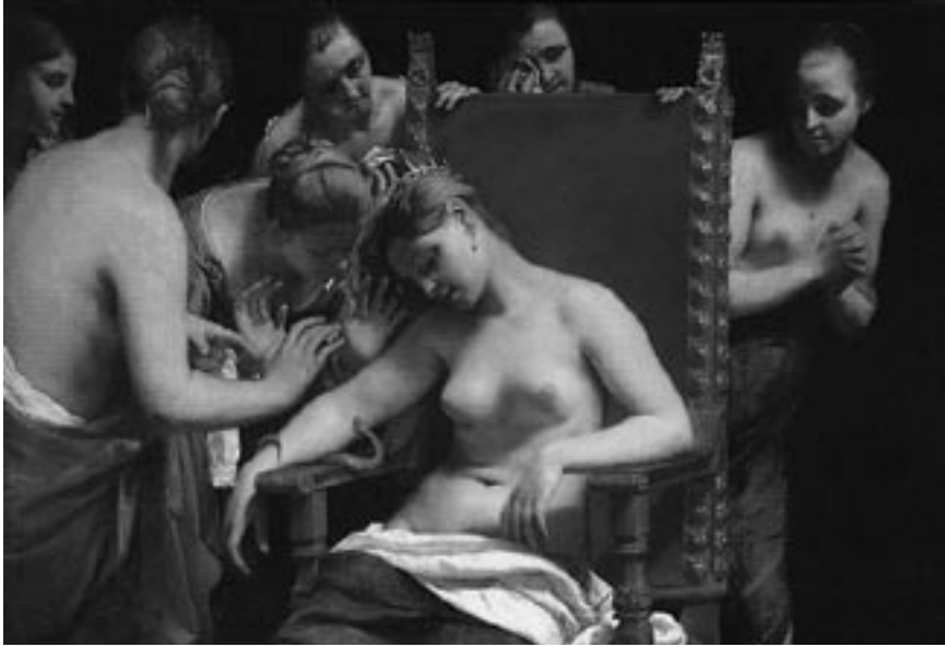
6. Guido Cagnacci, La muerte de Cleopatra , 1658.