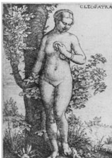
5. Cleopatra . Anónimo flamenco, h. 1550.

mechones y trenzas suspendidas, volátiles, que se entrelazan equívocamente con el cuerpo del reptil. La imponente presencia de la figura y el poder conferido al gesto y a la mirada completan los mecanismos de equivalencia. La simbiosis no pasaría desapercibida posteriormente a Shakespeare. Cleopatra ejerce una atracción medusea, irresistible y aniquiladora, reconocida por el propio Antonio 35 , que ve, además, cómo su identidad masculina se diluye ante la suplantación de roles que personifica Cleopatra. La reflexión sobre este hecho, lugar común en la cultura humanística 36 , está presente también en el dibujo de Miguel Ángel, que traduce su visión en una ambigüedad sexual evidente 37 .