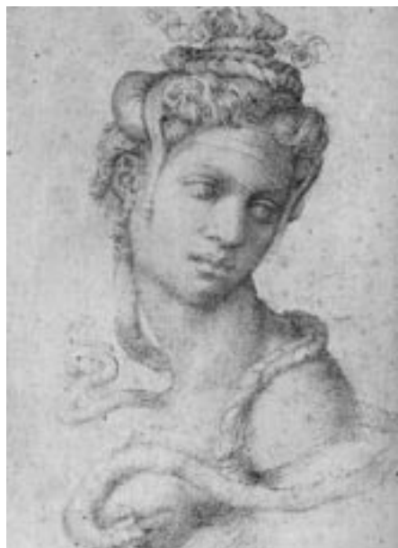
4. Miguel Ángel, Cleopatra , h. 1535.