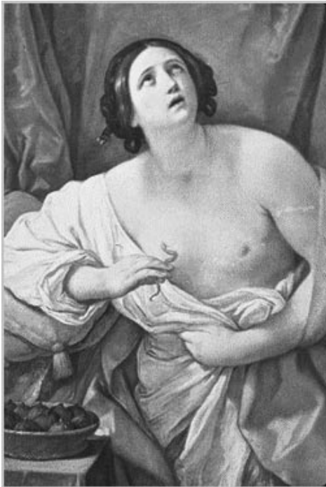
7. Guido Reni, Cleopatra , 1635-40.