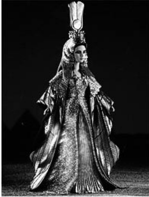
17. Barbie Liz Taylor como Cleopatra (Serie Leyendas de Hollywood), 1963.

Coincidiendo con el estreno de la película de Mankiewicz, salió al mercado una muñeca Barbie de Liz Taylor en el papel de la reina egipcia [fig. 17]. También Claudette Colbert fue inmortalizada en una muñeca que recordaba su legendaria actuación. Era una forma de ganar para la causa a un público aprendiz de femme fatale . Cleopatra se reinventa tras sus múltiples rostros, pero la esencia del perfil que nos ha cautivado desde siglos sigue siendo el mismo.