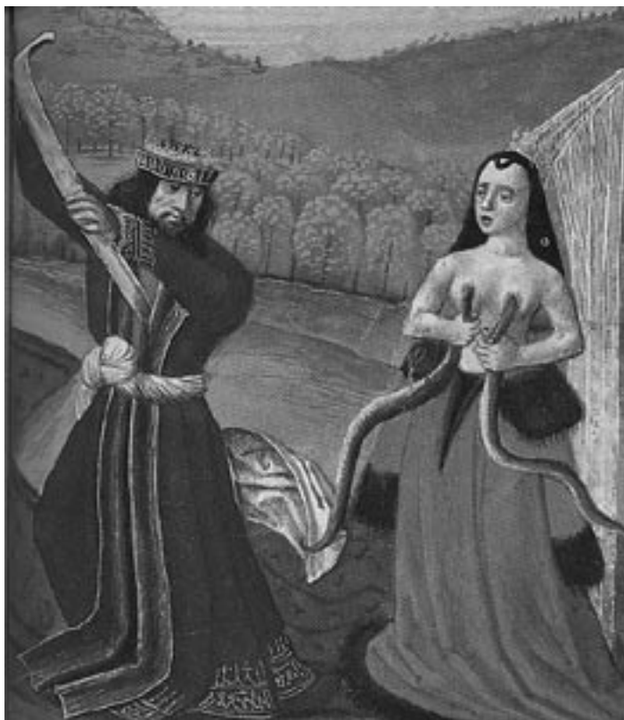
2. Muerte de Cleopatra y Antonio , h. 1450.

rey viril y decidido que apuesta por la muerte como la única salida posible, de ahí su actitud heroica y complaciente. Sin embargo, la soberana, presa de terror, expresa el dolor con el gesto y la pose. De tal calibre es su contingencia humana que el autor crea una simbiosis entre la mujer y los animales que la llevan a la muerte, haciendo que las cabezas de los reptiles, apenas perfiladas, parezcan hundirse en los senos, o salir de ellos.