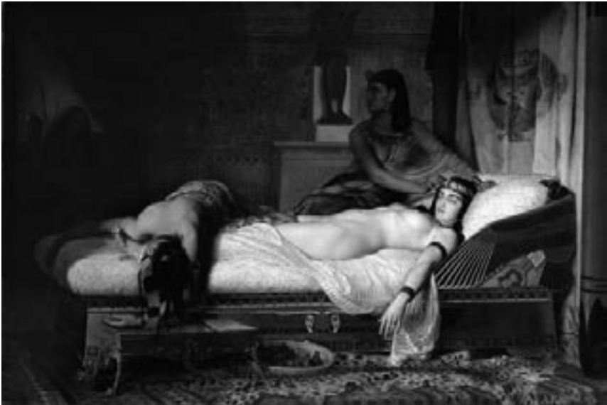
9. Jean-Andre Rixens, La muerte de Cleopatra , 1874.