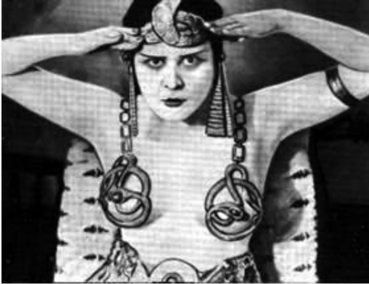
13. Theda Bara en Cleopatra , 1917.

marcado de los ojos, para redundar en los oscuros misterios del personaje, completa el efecto. El resultado es una Cleopatra suntuosa, seductora y enigmática, la encarnación perfecta de la fatalidad femenina [fig. 13].