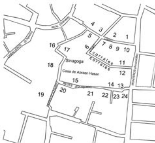
FIGURA N o 1 LA JUDERÍA EN ÉPOCA NAZARÍ

Aunque no podemos establecer con exactitud la extensión de la Judería, la ausencia de mezquitas en la zona y la ubicación de la sinagoga nos permite afirmar que la Judería la conformaba el sector delimitado por las actuales calles Alcazabilla, Zegrí y Postigo de San Agustín, como puede verse en el plano que hemos elaborado (Fig. I).