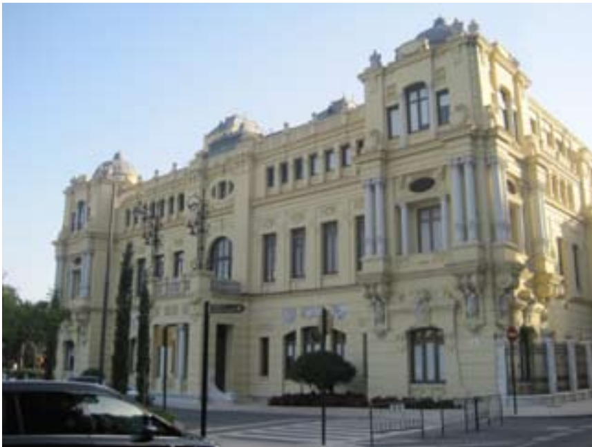
FIGURA N° 3 FACHADA ESTE DEL AYUNTAMIENTO (MÁLAGA)

cional de espacios claustrales, los tribunales de justicia y los parlamentos se conciben con voluntad de ser emblemas urbanos y símbolos del poder civil. Entendido como templo de la democracia, el parlamento de Londres (1837-1843) es un claro ejemplo de edificio historicista. Las sedes parlamentarias cuentan con ejemplos señeros en toda Europa y en toda América (el Reichstag de Berlín es uno de ellos).