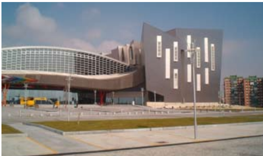
FIGURA N° 6 FACHADA PRINCIPAL PALACIO DE FERIAS Y CONGRESOS (MÁLAGA)