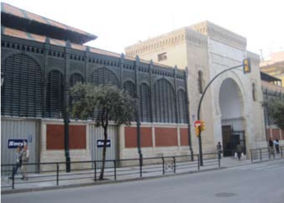
FIGURA N° 2 FACHADA SUR DEL MERCADO DE ATARAZANAS (MÁLAGA)

mercado que se proyectó pensando en una población de millones de habitantes y formaba parte del gran plan de transformación de París, concebido por Haussmann. Baltard realizó su primer proyecto en piedra en 1881 y fue un verdadero desastre. Haussmann lo hizo demoler y le exigió que lo hiciera únicamente en hierro. Se compone de dos grupos de pabellones que se comunican entre sí mediante pasos cubiertos. En la ciudad de Málaga aparece un modelo de mercado de estilo historicista. El proyecto que elaboró Rucoba en Málaga seguía las líneas marcadas por los mercados madrileños que por esos años se construyeron en la plaza de la Cebada y los Mostenses, los cuales, a su vez, remitían al gran mercado de Les Halles de París ya mencionado, que incorporaba la novedad de nuevos materiales como el hierro fundido. Se trata del Mercado de Atarazanas (ver fig. 2)