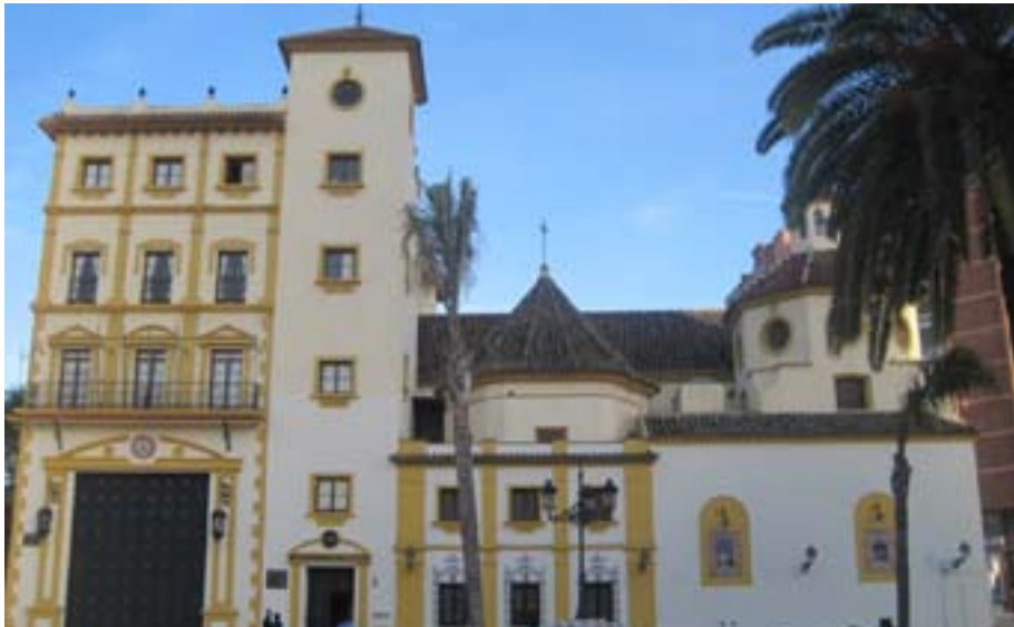
FIGURA N° 7 FACHADA NOROESTE DE LA COFRADÍA DE LA EXPIRACIÓN (MÁLAGA)

Sería imposible resumir en unos párrafos la importancia de los equipamientos religiosos en la ciudad desde sus orígenes, ya que desde la antigüedad los avances y nuevas tipologías arquitectónicas se plasmaron en los edificios religiosos. Basílicas paleocristianas, iglesias románicas, catedrales góticas, son algunos de los ejemplos. Sin embargo, a partir de la revolución industrial, la nueva situación general generó nuevos temas edilicios por lo que la iglesia perdió su importancia como tema principal. No obstante, con las corrientes historicistas, se acepta en todo el mundo al gótico con alguna derivación románica o bizantina como la modalidad natural de la arquitectura eclesiástica en el siglo XIX. También se utilizan nuevos materiales como el hormigón armado, por ejemplo Baudot, quien proyectó la iglesia de San Juan de Mont Matre en dicho material. Es la primera vez que este material “vulgar” como se llamaba en aquella época fuera utilizado en un edificio noble. En época funcionalista, Le Corbusier en la década de los cincuenta del siglo XX, realiza Nôtre-Dame-Du-Haut, en Ronchamp.