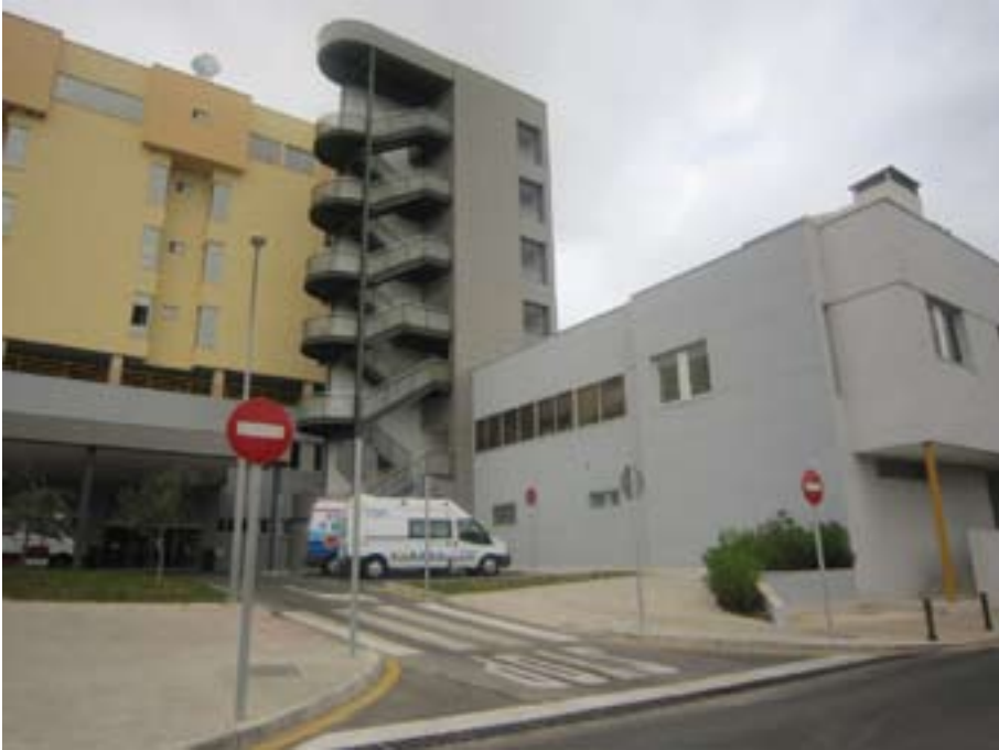
FIGURA N° 1 FACHADA ESTE. HOSPITAL CLÍNICO (MÁLAGA)