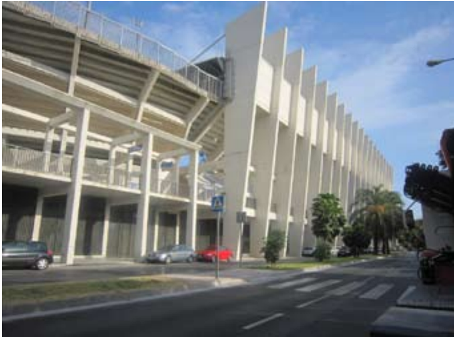
FIGURA N° 8 FACHADA OESTE DEL ESTADIO DE LA ROSALEDA (MÁLAGA)

En Málaga destaca el estadio de la Rosaleda, presentando en la actualidad en el exterior los signos de una remodelación reciente, que tiende a la monumentalidad antes mencionada (ver fig.8).