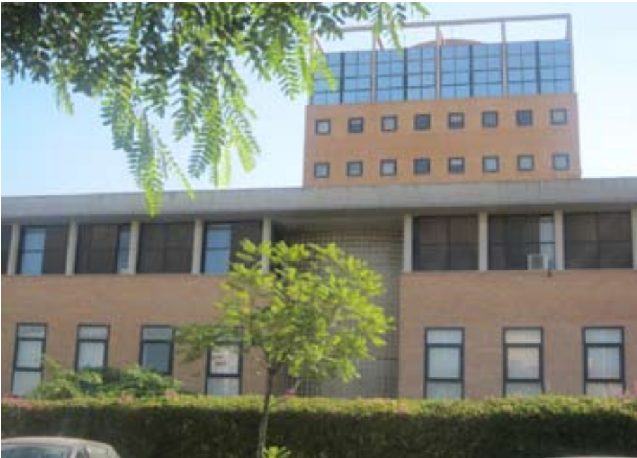
FIGURA N° 4 FACHADA DE LA FACULTAD DE PSICOLOGÍA (MÁLAGA)

Málaga cuenta con una universidad localizada en dos campus, El Ejido y Teatinos, en ambos se pueden encontrar representaciones de distinta tipología arquitectónica desde funcionalistas como por ejemplo el pabellón de gobierno situado en el Campus El Ejido hasta tipologías postfuncionalistas en el Campus de Teatinos como la Facultad de Psicología (ver fig.4).