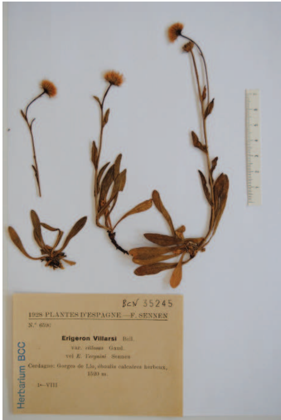
Figura 1. Lectótipo de Erigeron verguinii Sennen (BCN 35245). Lectotype of Erigeron verguinii Sennen (BCN 35245).