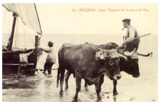
Es frecuente encontrar entre las primeras postales ilustradas temáticas que recuerdan a los gustos fotográficos de los aficionados que en esta época están reflejando una España tradicional abocada a una imparable transformación (postal circulada en 1910)

tendrán cabida en su espacio, por lo que ahora es muy revelador poner en relación unas imágenes con otras y es posible descubrir el desarrollo del país en todos sus aspectos, ya sean productivos, sociales, culturales, urbanísticos, políticos o mostrando acontecimientos de importancia que no solo se recogen en la páginas de la prensa. Así sucesos que golpean a la opinión pública como la Semana Trágica de Barcelona en 1909, o el atentado en la boda de Alfonso XIII en 1906, conocerán varios tirajes en tarjeta postal, junto a la guerra de África y otros temas de actualidad.