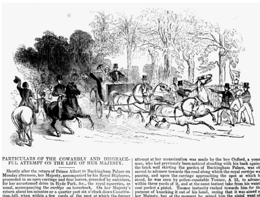
Primeros ensayos de la "actualidad" gráfica. The illustrated London News julio 1842.

Porque la imagen impresa para usos informativos, contaba ya con una larga tradición cuando apareció la tarjeta postal. Aunque es un lugar común suponer que fue la fotografía la que puso en marcha la información gráfica en las sociedades modernas, lo cierto es que la fotografía en su desarrollo tecnológico y como lenguaje comunicativo se encontró con que las revistas