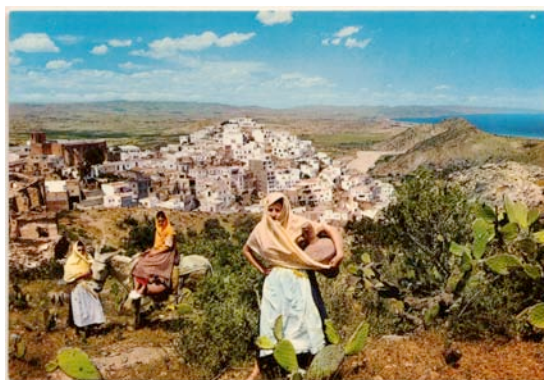
En su etapa de decadencia la tarjeta postal mostrará el desarrollismo español de la época franquista y en algunos de sus temas intentará reproducir una visión nostálgica y falsificada del pasado coincidente con los arquetipos de la imagen turística nacional (imagen de Mojácar editada en 1970)

censura y no podían mostrar imágenes de localidades por cuestiones de inteligencia militar. Durante el largo franquismo, la tarjeta postal irá cambiando de formatos y se usará cuando comience la apertura del régimen en la década de los años cincuenta de un modo institucional para difundir una imagen