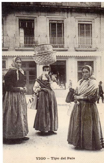
La tarjeta postal, por su variedad temática permite el estudio de múltiples aspectos del momento en el que se difundieron (Circulada en 1914) Col. Particular .

Ahora que su uso tradicional ha entrado en decadencia, parece un buen momento para analizar algunos de los valores instituidos por la tarjeta postal ilustrada. Un objeto, considerado durante mucho tiempo como de escaso valor cultural, pero que presenta una serie de interesantes paradojas. Se trata de un producto para las redes postales del siglo XIX que fue diseñado para unas utilidades técnicas y comerciales específicas y que muy pronto fueron extendidas a una amplia gama de usos sociales más allá de su concepción original como objeto postal económico y eficiente. Siendo una invención decimonónica, la tarjeta postal va a desarrollarse, sin embargo, a lo largo del siglo XX, y encontrará en la sociedad de las masas su vehículo ideal, junto a la prensa gráfica, el cinematógrafo y la fotografía de aficionado. De todas estas tendencias se aprovechará también la tarjeta postal ilustrada, hasta el punto de que hoy puede también ser estudiada como un medio que muestra el desarrollo del país en múltiples facetas tanto por el extenso contenido como por la amplitud temática de las imágenes que porta 1 .