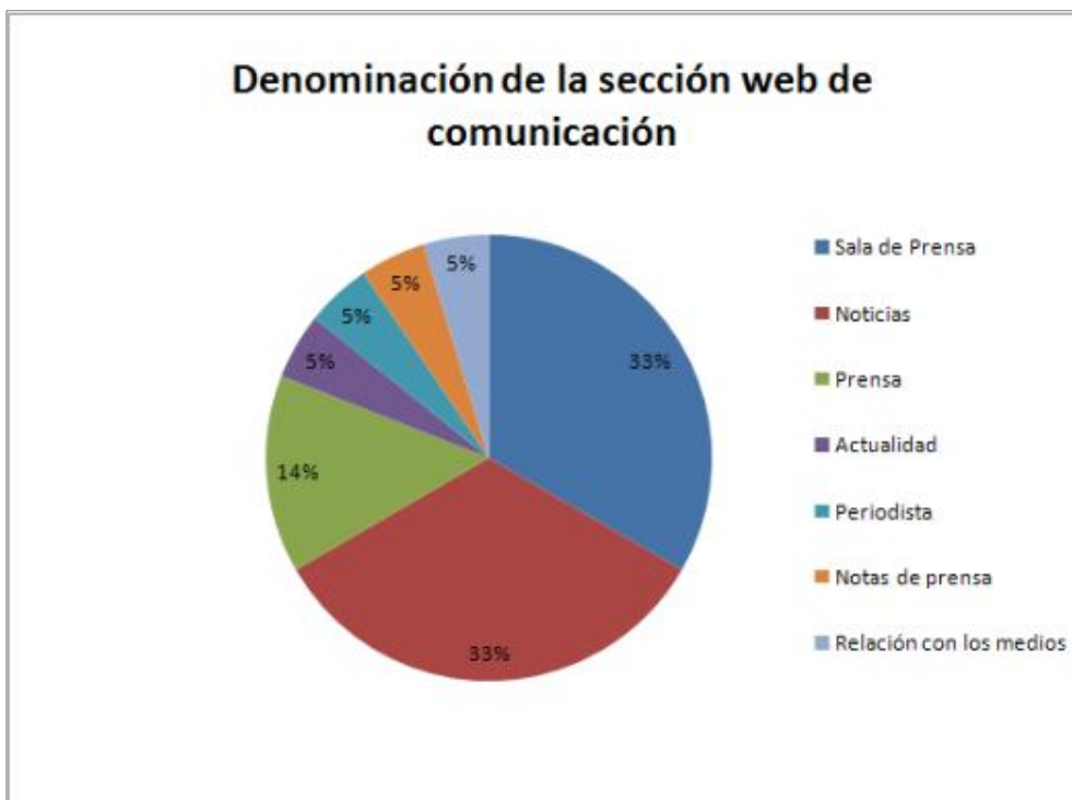
Gráfico 1: Denominación de la sección web de comunicación