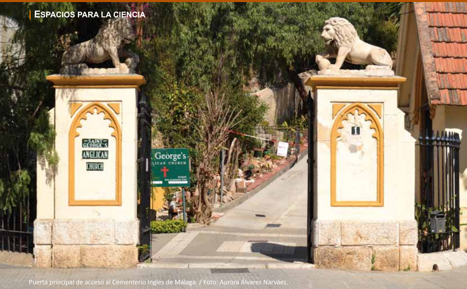
Puerta principal de acceso al Cementerio Inglés de Málaga.