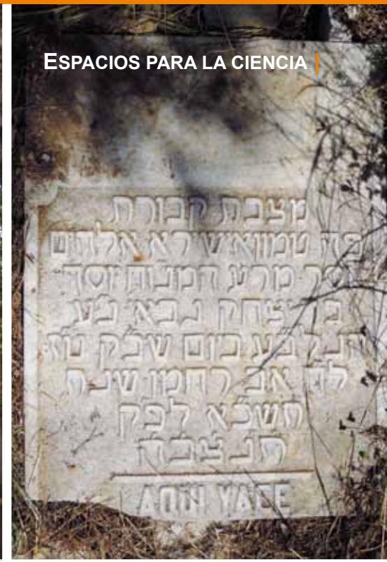
El Cementerio Inglés cuenta con numerosos elementos arquitectónicos singulares. Destacan las cruces celtas, los ángeles románticos, caracteres hebreos, templetos o las tumbas de personajes ilustres como Gerald Brenan o los restos de los naufragos del Gneisenau.

fantiles de ladrillos de adobe y conchas. Un solar donde también fue inhumado -como primer enterramiento intramuros- el cuerpo del heroico Robert Boyd, fusilado junto al general Torrijos en la playa malagueña de San Andrés.