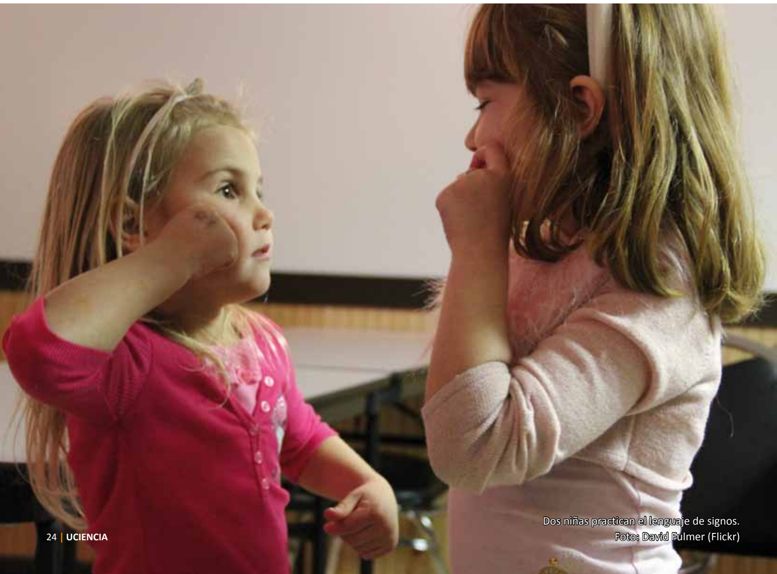
Dos niñas practican el lenguaje de signos.

Desde muy pronto se crean las primeras conexiones neuronales que acabarán dando soporte al desarrollo lingüístico