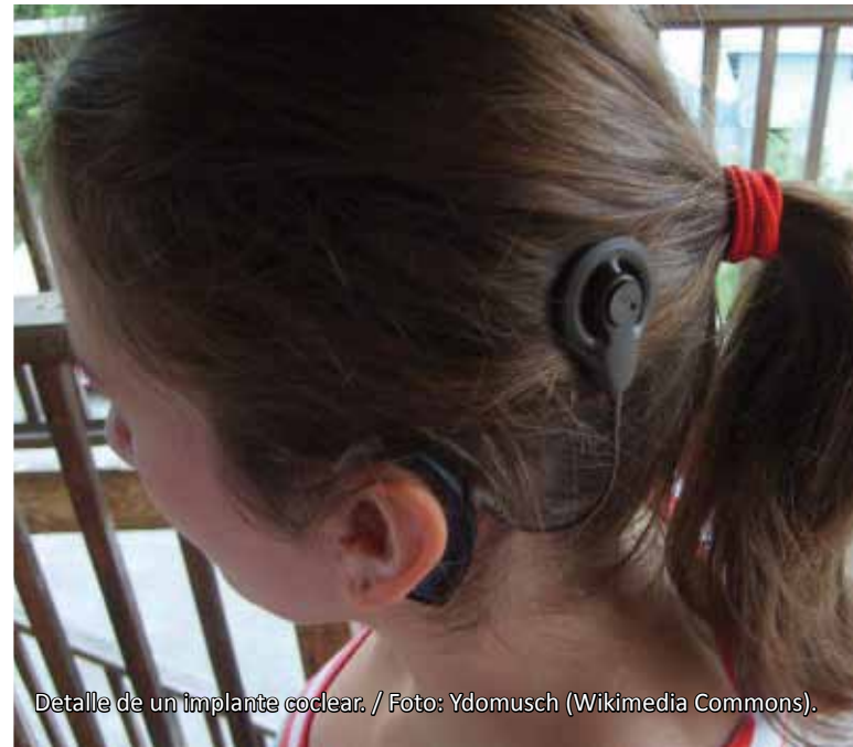
Detalle de un implante coclear. / Foto: Ydomusch (Wikimedia Commons).