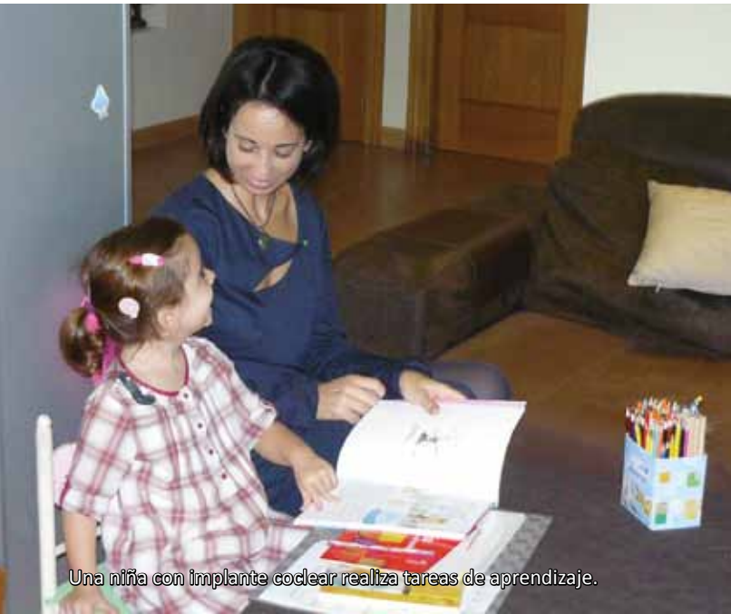
Una niña con implante coclear realiza tareas de aprendizaje.