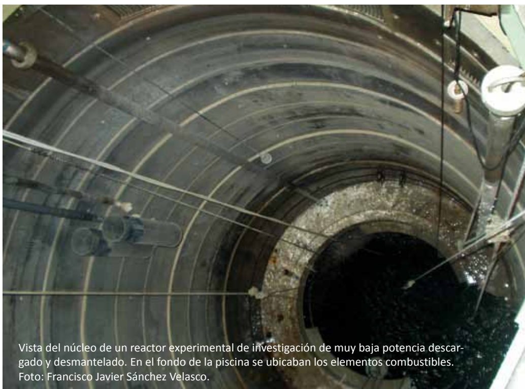
Vista del núcleo de un reactor experimental de investigación de muy baja potencia descargado y desmantelado. En el fondo de la piscina se ubicaban los elementos combustibles.

dad o la circulación natural. De hecho, algunos garantizan la integridad de la central sin la intervención del operador durante al menos 72 horas.