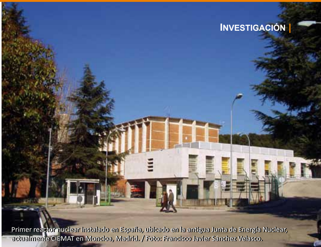
Primer reactor nuclear instalado en España, ubicado en la antigua Junta de Energía Nuclear, actualmente CIEMAT en Moncloa, Madrid.

La central española de Vandellós se construyó a 21 metros sobre el nivel del mar para prevenir el posible impacto de las olas