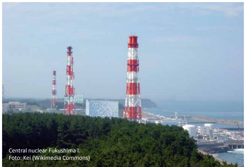
Central nuclear Fukushima I.

En España la situación es diferente. Es un país con mucha menor actividad sísmica que Japón. La poca existente se localiza en el sureste español donde no hay centrales nucleares. En el caso de Lorca, los geólogos indican que probablemente el terremoto ha sido una consecuencia del reacoplamiento de las placas pacífica y euroasiática cerca de la costa japonesa el pasado marzo.