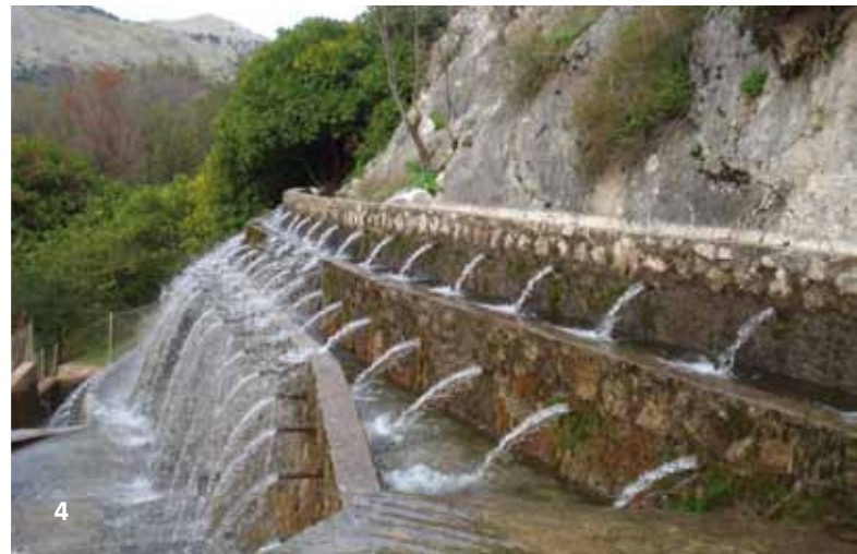
1. Manantial de la Cueva del Gato (Sierra de Líbar), cuyas aguas vierten al río Guadiaro. / Foto: Antonio Castillo Martín. 2. Manantial de Benaoján (Sierra de Líbar), vertiente al río Guadiaro. 3. Paraje del nacimiento del río Grande (Yunquera). 4. Fuente de los Cien Caños y vegetación de las inmediaciones, en la cuenca alta del río Guadalhorce. / Fotos: Archivo CEHIUMA.

al que vierten sus aguas los manantiales de la sierra de Líbar, y los ríos Genal, Verde y Grande, que nacen en surgencias de la Sierra de las Nieves. También el río Guadalhorce, en su cabecera, es alimentado por agua de manantiales de las sierras de San Jorge y Camarolos, y del Torcal de Antequera. Por su parte, en la zona oriental de la provincia, el río Vélez recibe el agua del manantial de Guaro (Periana), y algunas surgencias de las sierras de Tejeda y Almijara son origen de ríos como el Bermuza, Torrox y Chíllar, entre otros. Muchos de estos manantiales merecerían disponer de protección como elementos singulares de geo e hidrodiversidad.