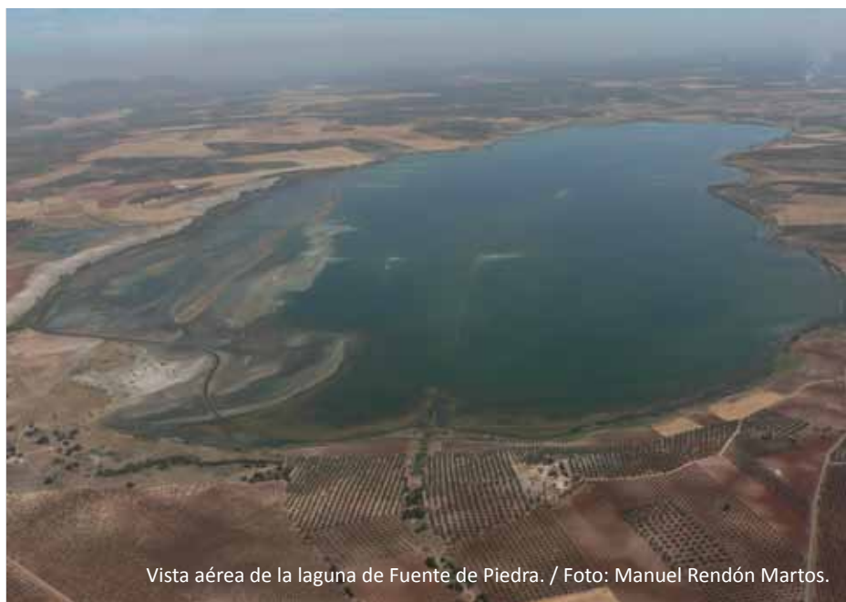
Vista aérea de la laguna de Fuente de Piedra.

co rosa ( Phoenicopterus ruber roseus ), que es la manifestación más espectacular de una rica biodiversidad. Sin embargo, es menos conocido que la laguna se en-