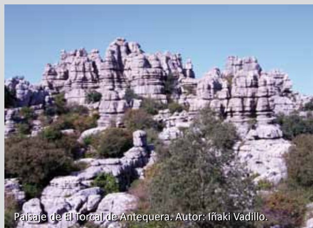
Paisaje de El Torcal de Antequera. Autor: Iñaki Vadillo.

En los últimos años se han desarrollado iniciativas internacionales como Global Geosites, que pretende identificar los lugares más representativos de la evolución de la Tierra, y European Geoparks, encaminada a promover el desarrollo sostenible y la conservación y divulgación de los recursos geológicos. En Andalucía hay dos geoparques (Cabo de Gata-Níjar y Sierras Subbéticas) pero la geodiversidad de sus provincias, entre ellas la de Málaga, es suficientemente rica como para justificar la creación de algunos más.