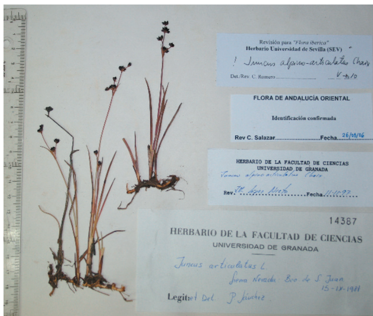
Figura 1. Juncus alpino-articulatus (Granada: Sierra Nevada, Barranco de San Juan, GDAC 14387).

ALMERÍA. Almería . Carboneras (HUAL 8792). Alpujarras . Sierra de Gádor, 500 m (HUAL 1723). Nevada-Filabres . Abla, Sierra de los Filabres (HUAL 7164). Vélez-Baza . Rambla de Lúcar