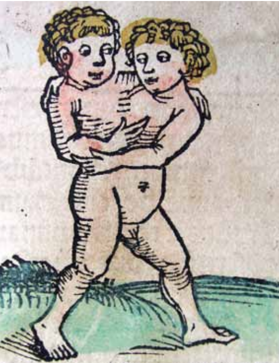
Ilustración de siameses en el medioevo por Hartmann Schedel.

desarrollo anormal del embrión, si no conduce a la muerte por aborto espontáneo, puede causar graves alteraciones que afectan de forma diversa al niño que acaba de nacer. Estas anomalías reciben el nombre de “malformaciones congénitas”. El llamado diagnóstico preimplantacional realiza búsqueda de defectos genéticos que puedan causar enfermedades congénitas graves, brindando a los padres la posibilidad de optar por un aborto terapéutico.