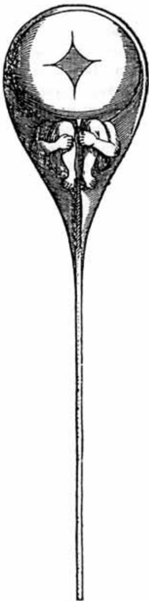
”Homúnculo (Nicolás Hartsoecker, 1694). Las teorías preformacionistas, hoy ampliamente refutadas, sugerían que los seres vivos se desarrollaban a partir del crecimiento de un hombrucillo minúsculo (homúnculo) encerrado en el espermatozoide”.

también los científicos que dedican sus esfuerzos a resolverlos. La embriología debe ser considerada como una ciencia moderna e integradora. Gracias a ella la práctica clínica mejorará hasta extremos todavía insospechados... ¡Aún nos queda mucho por ver! ●