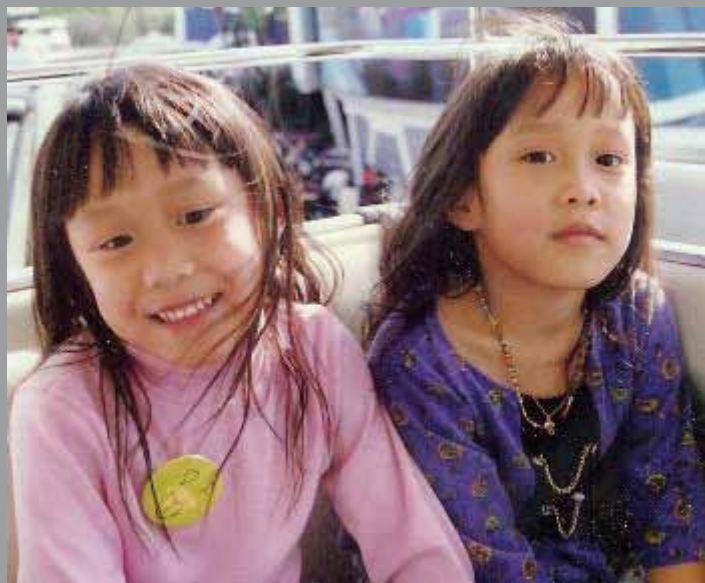
Gemelas monozigóticas de Korea.

ra monozigóticos, ya que ambos se desarrollan a partir de un único embrión. En el caso de los gemelos se distinguen diversos subtipos, dependiendo de la cantidad de membranas extraembrionarias que compartan. Sólo en el caso de que los gemelos monozigóticos compartan dos amnios y corion se corre el riesgo de que la separación entre los dos individuos durante el desarrollo no sea completa, apareciendo eso que conocemos por hermanos siameses.