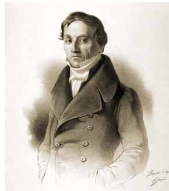
Karl Ernst von Baer, anatomista alemán y padre de la embriología moderna.