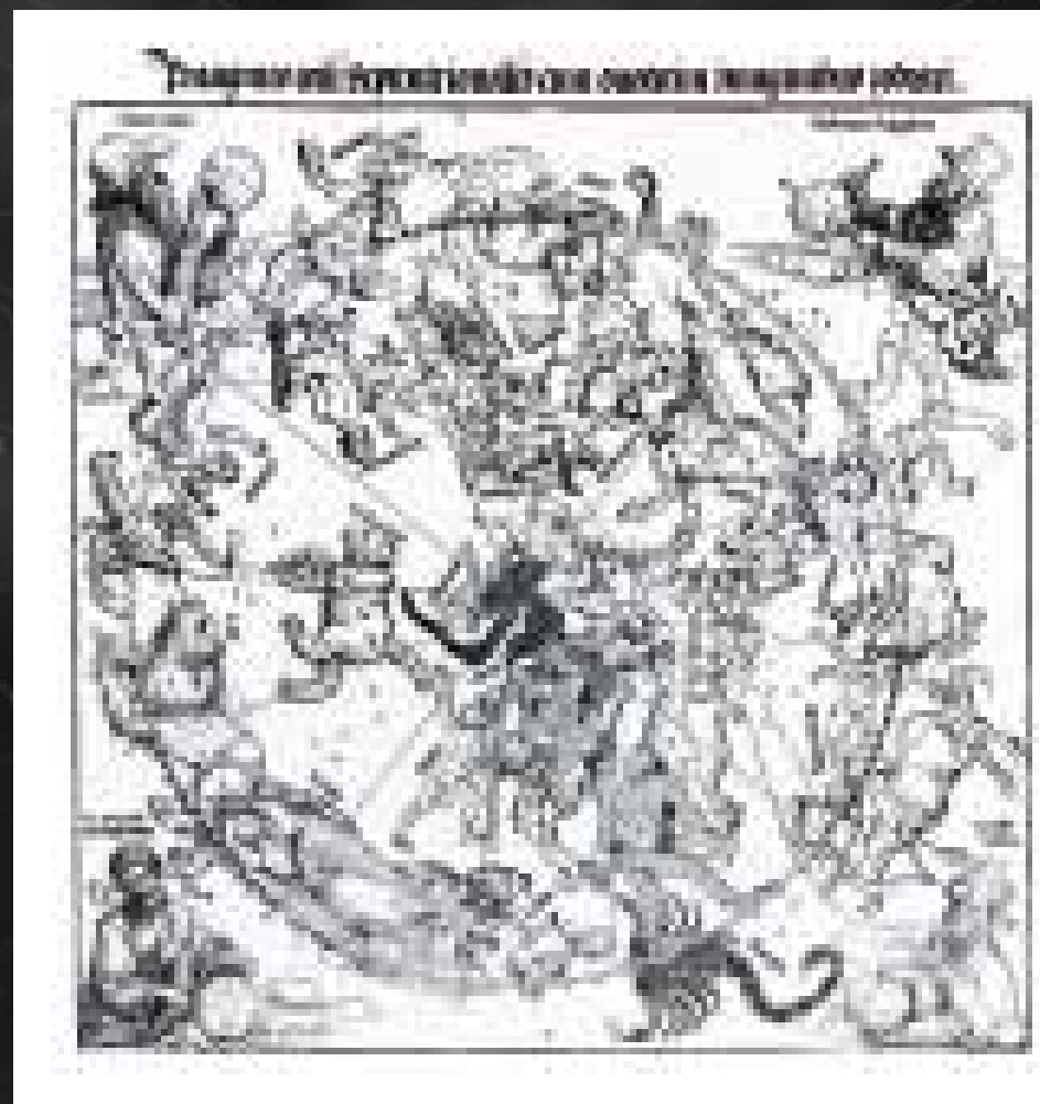
5. Dürero, grabado con las constelaciones del planisferio norte (en la parte superior, figuras de Arato a la izq. y de Ptolomeo a la dcha.).

La astronomía quedaría prácticamente cerrada hasta el siglo XVII, cuando todavía Galileo Galilei se mantenía fiel al diseño geocéntrico