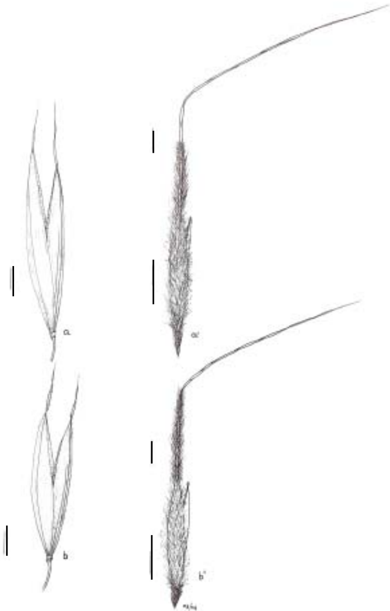
Figura 1. Glumas y antecio con arista de Macrochloa tenacissima subsp. tenacissima (Loefl. ex L.) Kunth (b y b') y Macrochloa tenacissima subsp. umbrosa F.M. Vázquez subsp. nov (a y a'). Las barras indican 4 mm. Glumes, anthercium and awn of Macrochloa tenacissima subsp. tenacissima (Loefl. ex L.)Kunth (b and b') and Macrochloa tenacissima subsp. umbrosa F.M. Vázquez subsp. nov (a and a'). The bars are 4 mm.