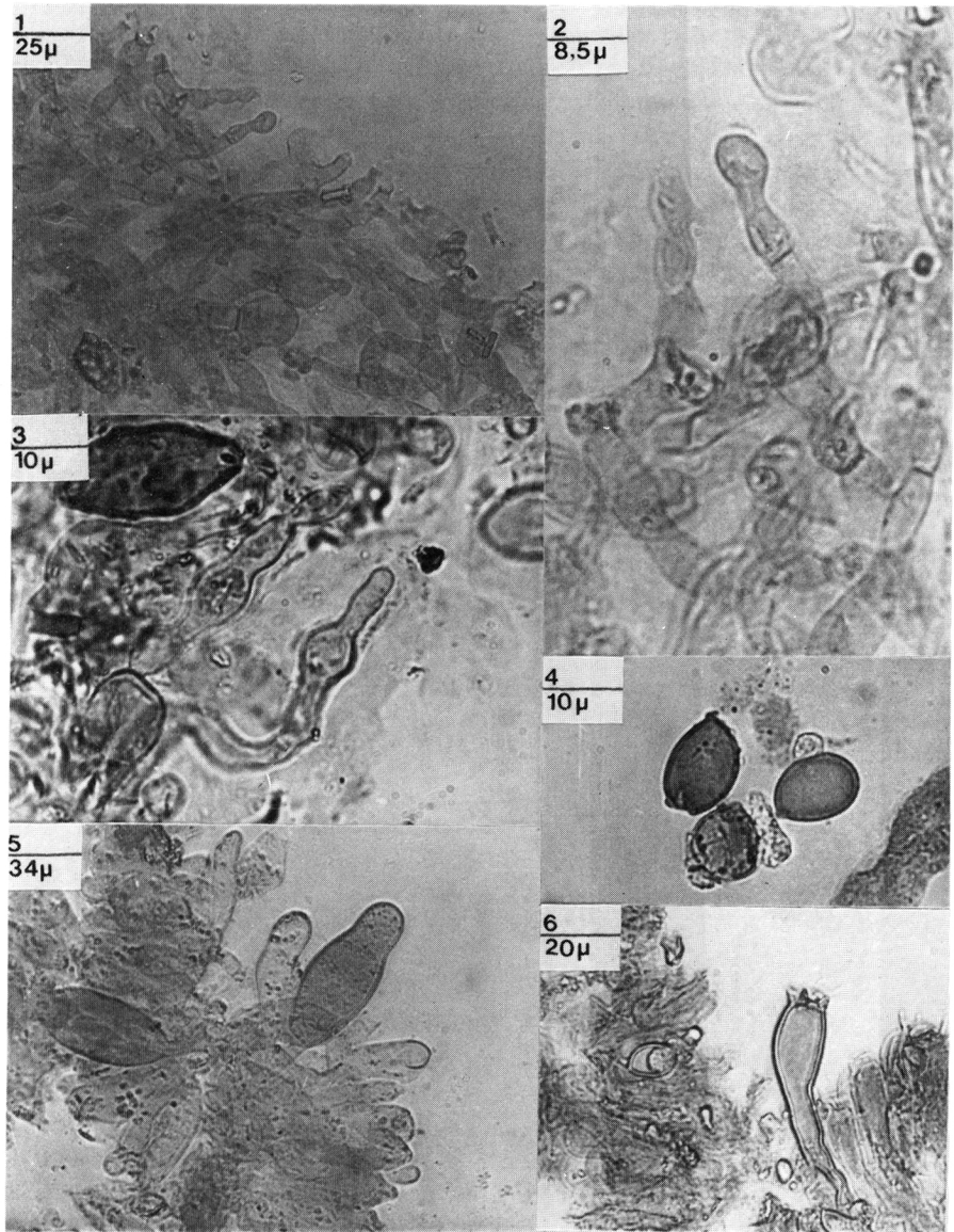
Figs. 1 a 6. Oudemansiella mediterranea : Cutícula: células (1-2); Pelos cuticulares (3); Esporas (4); Pleurocistidios (5); Basidios (6).