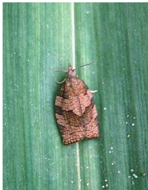
Figura 2 - Adulto de Pandemis heparana .