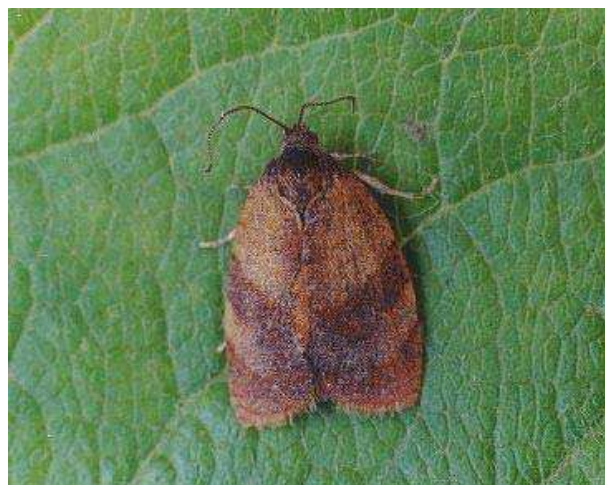
Figura 1 - Adulto de Cacoecimorpha pronubana .

Foram observadas capturas de Cacoecimorpha pronubana (Figura 1) e Pandemis heparana (Figura 2), em todos os locais monitorizados e em todas as culturas em que as armadilhas foram instaladas. Não houve capturas de Adoxophyes orana , de Pandemis ribeana (= cerasana ) e de Cydia molesta .