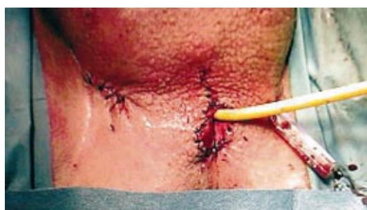
Fig. 6 - Uretrostomia perineal

um biofilm que se desenvolve a partir de material mucinoso composto de polissacaridos, aderindo e envolvendo a prótese, servindo de nutriente para o crescimento bacteriano, protegendo-as da acção dos antibióticos e do sistema imunitário do hospedeiro 11 .