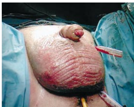
Fig. 5 - Construção de Pseudo Pénis