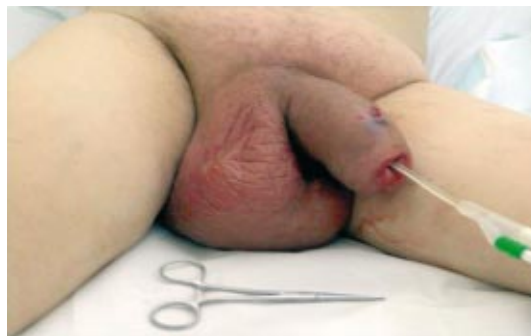
Fig. 1 - 30º dia Pós-operatório

Ao 15º dia refere aparecimento de edema e dor ao nível dos genitais. Recorre ao médico apenas ao 30º dia de pós-operatório, apresentando eritema, edema e dor dos genitais bastante acentuada e edema dos membros inferiores (Fig. 1). Analiticamente apresentava 28,3 \times 10^3 \mu\text{L} leucócitos e PCR-26,40 mg/dL, mantendo a glicémia dentro de valores normais (77mg/dL). Realizou TC que revelou implante protésico correctamente colocado dentro dos corpos cavernosos, sem presença de erosão ou abscesso (Fig. 2). Iniciou antibioterapia endovenosa com Metronidazol 1g e.v. 12/12h, Gentamicina 160mg e.v. 24/24h e Amoxicilina+Ácido Clavulâmico 1,2g e.v. 12/12h. Procedeu-se à remoção cirúrgica do implante em 28/11/2008 por via subcoronal com drenagem dos corpos cavernosos e lavagem abundante com Gentamicina. A cultura revelou Staphylococcus epidermidis e E.coli . Manteve antibioterapia endovenosa, drenagem e lavagem dos corpos cavernosos. Ocorreu uma melhoria clínica ligeira com diminuição do edema e eritema dos genitais e membros inferiores e melhoria analítica (leuc-10,0; PCR-4,74). Na sequência de aparecimento de necrose ao nível da glande e pre-