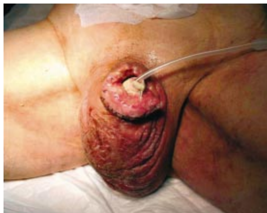
Fig. 4 - Limpeza cirúrgica

Quando a infecção ocorre, a remoção imediata da prótese, é tida como o procedimento a tomar. O organismo mais frequentemente isolado é o Staphylococcuse epidermidis (70%) 9 que é adquirido durante a introdução da prótese. Outros organismos também isolados são os Enterococcus , Pseudomonas e Staphylococcus aureus , estando estes associados a um aparecimento precoce da infecção 10 . Estas infecções são difíceis de tratar devido a