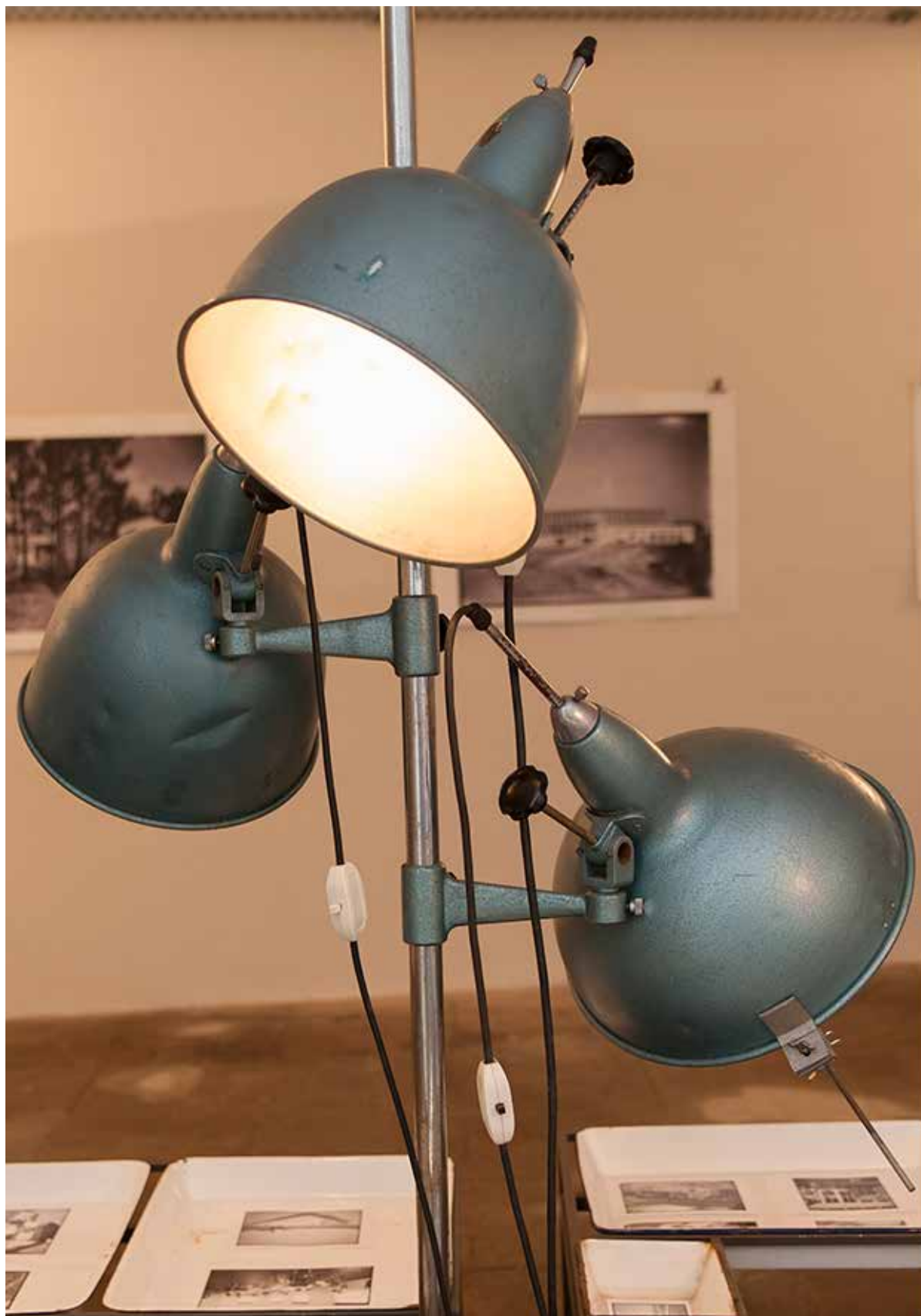
Exposição "Arquitectura Moderna no Arquivo Teófilo Rego", Casa da Imagem, Vila Nova de Gaia, 2015.