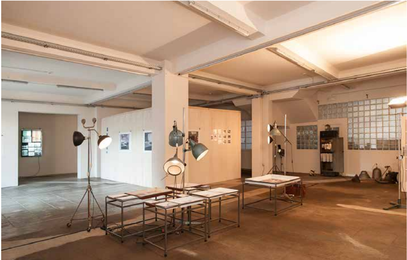
Exposição "Arquitectura Moderna no Arquivo Teófilo Rego", Casa da Imagem, Vila Nova de Gaia, 2015.