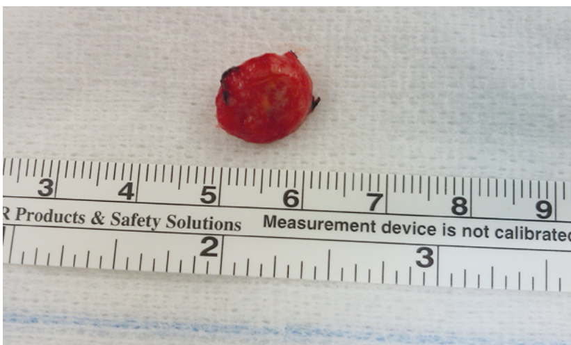
| FIGURA 3 | Aspecto macroscópico do aneurisma venoso palmar