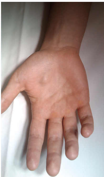
| FIGURA 1 | Tumefação não pulsátil da região palmar da mão direita

O pos-operatório decorreu sem intercorrências tendo o doente tido alta no próprio dia.