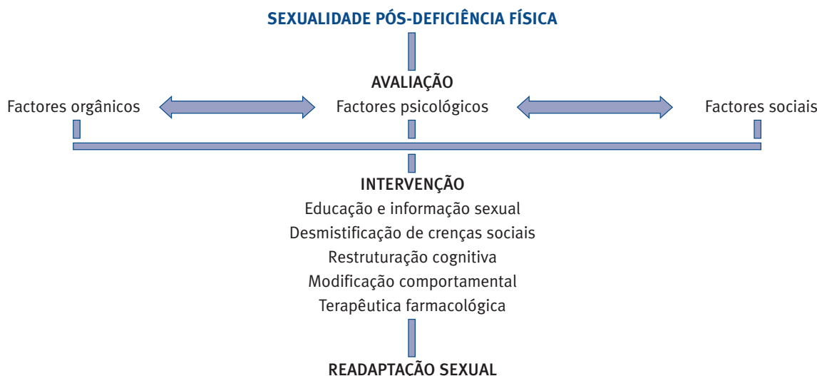
FIGURA 2 - MODELO DE REABILITAÇÃO SEXUAL PÓS-DEFICIÊNCIA FÍSICA

No que concerne à avaliação , importa considerar os aspectos orgânicos, psicológicos (quer individuais quer relacionais) e sociais: