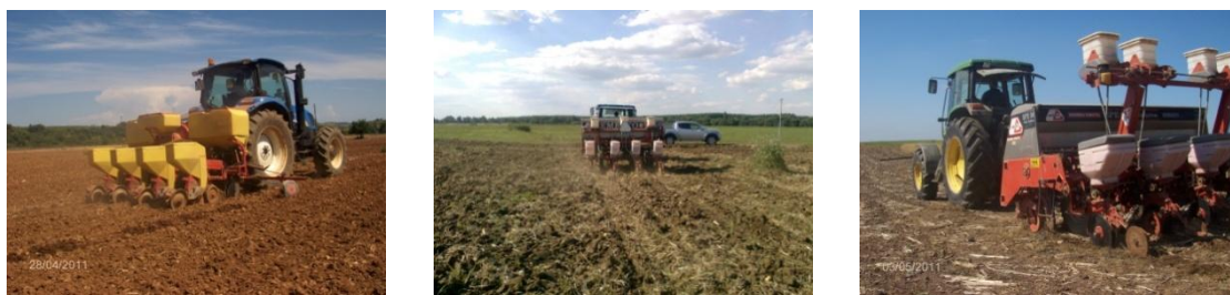
Fig. 1. Operações de sementeira e máquinas utilizadas em cada uma das parcelas (da esquerda para a direita): sementeira em mobilização convencional (Pigeiro), sementeira em mobilização mínima (Comenda) e sementeira direta (Lages).

de texturas franco argilosas para os solos das parcelas em que se realizou o milho em MC e MM e argilosas para a parcela em SD. No sistema de MC o solo antes da operação de sementeira foi sujeito a: uma passagem de chísel a cerca de 30 cm de profundidade, uma passagem cruzada de grades de discos e uma passagem com um rototerra. Em MM a preparação da cama de sementeira fez-se com uma passagem cruzada de grade de discos. À data de sementeira as percentagens de humidade do solo determinadas a 60°C eram de 14.8%, 11% e 12,5% para as parcelas em MC, MM e SD, respetivamente. Os semeadores utilizados foram em MC marca RAU modelo Maxem, em MM marca Semeato modelo SPE e em SD marca Semeato modelo SSE. Todos os semeadores têm um trem de sementeira, constituído por 4 linhas, com uma entre linha de 0.75m, órgãos sulcadores de duplo disco desfasado, roda controladora de profundidade e controlo de pressão da linha por tensão mecânica de uma mola amortecedor ajustada para 3 cm de profundidade. A densidade de plantação usada foi de 85000 plantas por hectare. As velocidades médias de operação foram de 4 km h -1 em MC e MM. Em SD usaram-se duas velocidades de trabalho de 4 e 6km h -1 .