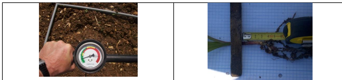
Fig. 2. Mostrador do penetrómetro de cone para determinação da resistência mecânica do solo ao rompimento (à esquerda) e determinação da profundidade de sementeira pela avaliação do comprimento do mesocótilo de plantas de milho pós emergência.

A resistência do rompimento do solo à penetração foi avaliada com recurso a um penetrómetro de cone da marca Dickey John em pontos georeferenciados com um equipamento de GPS da marca Magellan modelo Mobile Mapper CX no decurso das operações de sementeira. Em cada ponto, aleatoriamente escolhido, foram retirados 3 valores à profundidade de até 5 cm. Após emergência da cultura, nos mesmos pontos georeferenciados foram colhidas 4 plantas nas quais se determinou a profundidade de sementeira pela avaliação do comprimento dos respetivos mesocótilos (figura 2).